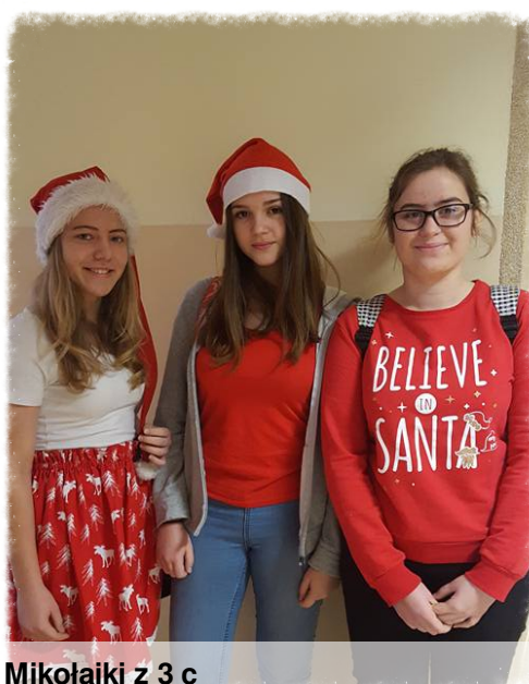
Mikołajki z 3 c