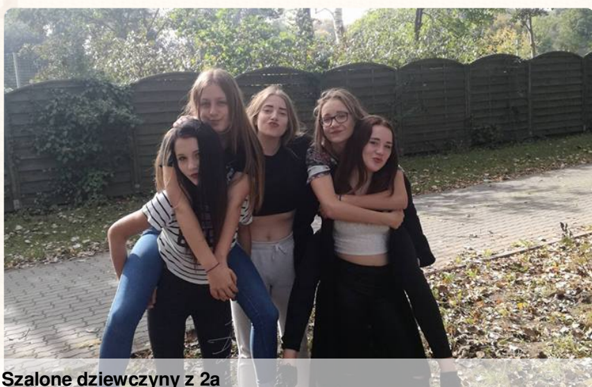
Szalone dziewczyny z 2a

29.09.2016r. wybraliśmy się na wycieczkę klasową do zoo by zobaczyć nowe zwierzęta i lepiej się poznać.