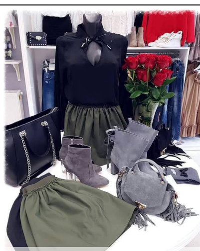
Julia poleca w tym miesiącu