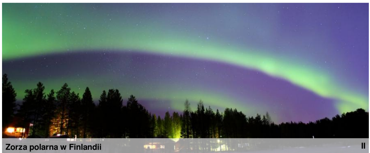
Zorza polarna w Finlandii