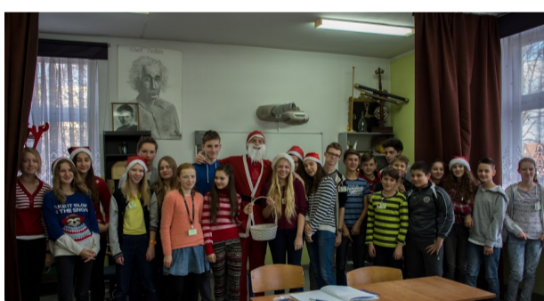
I D była grzeczna:)