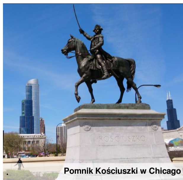
Pomnik Kościuszki w Chicago

Bitwa pod Saratogą 1777r. Kościuszko Generałem Brygady- 1784r. Walka o niepodległość w USA- 1775r.-1783r.