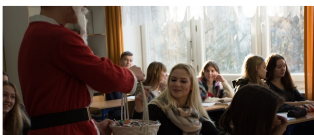
Mikołaj miał dużo pracy...