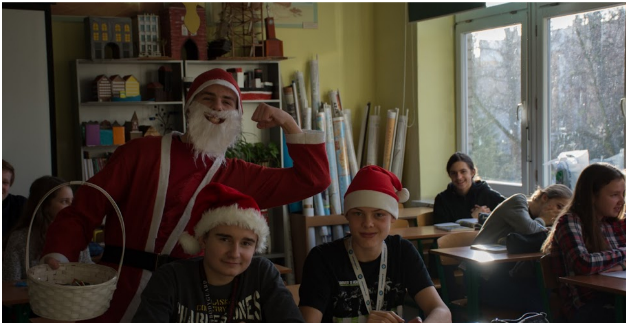
Odwiedziny Mikołaja w szkole