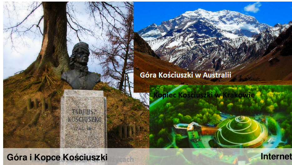
Góra i Kopce Kościuszki