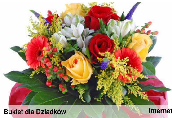
Bukiet dla Dziadków

Najlepszych wnucząt, Odpochniku, Ambitnego życia, Kwiatów w bukietcie, Samych radości, I ciasta smacznego, Zdrowia w przyszłości, Ewentualnie pysznego, ABY się zrealizowały marzenia, Miłych i słonecznych dni. Miłości spełnienia,