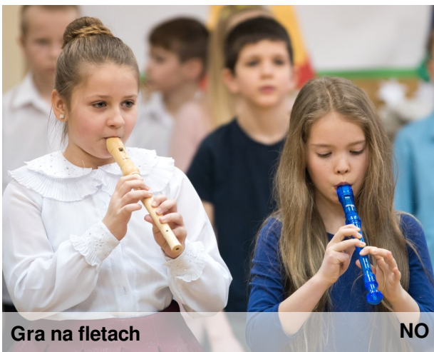
Gra na fletach