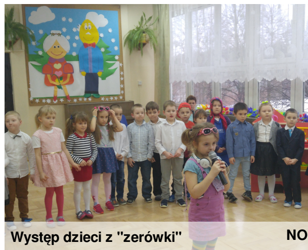
Występ dzieci z "zerówki"

Po występie dzieci wręczyły babciom własnoręcznie wykonane bransoletki, a dziadków obdarowały filcowymi muchami.