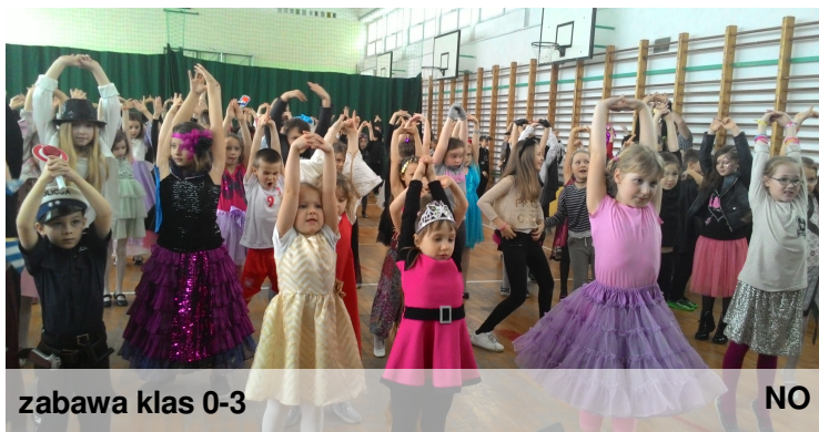
zabawa klas 0-3