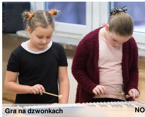
Gra na dzwoneczkach