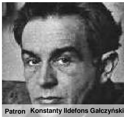
Patron Konstanty Ildefons Gałczyński