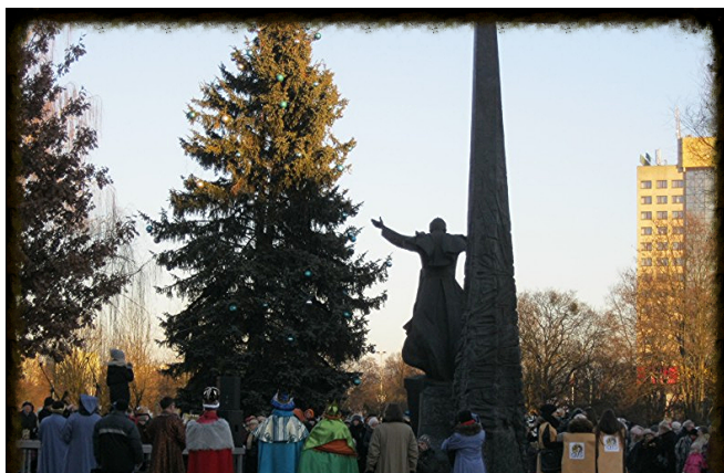
Orszak ruszył spod pomnika Jana Pawła II