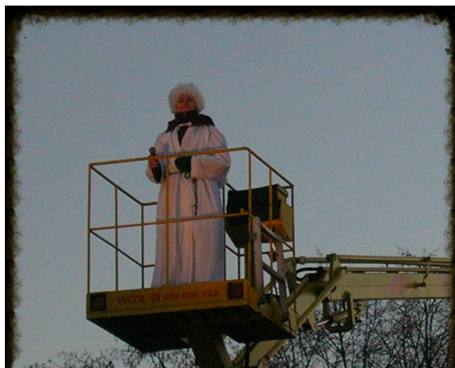
Anielski głos z wysokości uwielbiał Boga