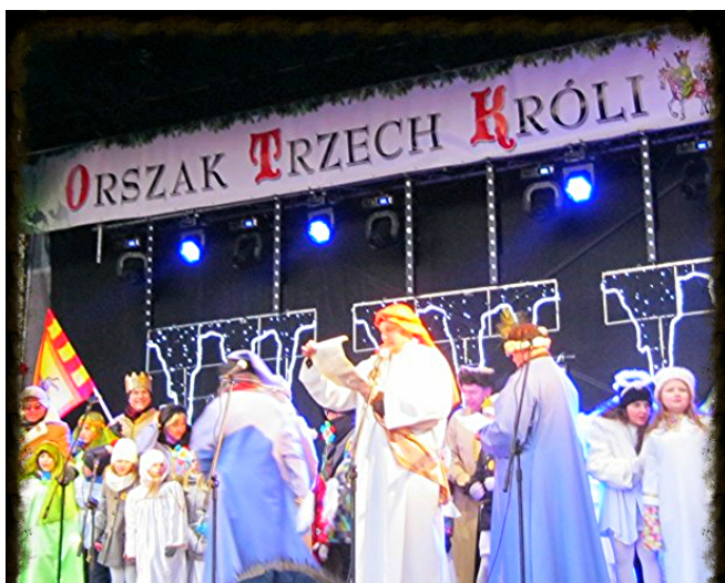
Po marszu w mrozie dotarliśmy do stajenki