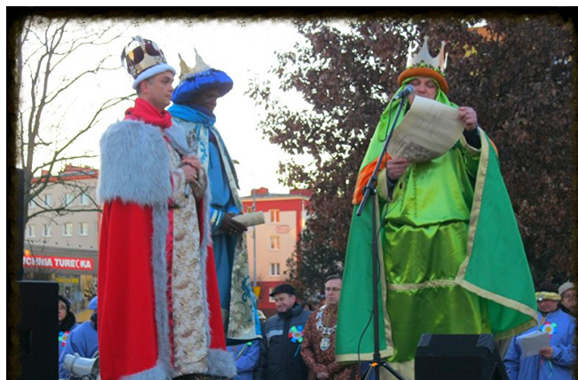
Królowie zaprosili wszystkich do orszaku