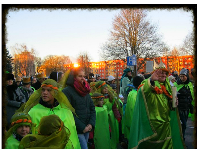
Każdy kontynent miał swój kolor