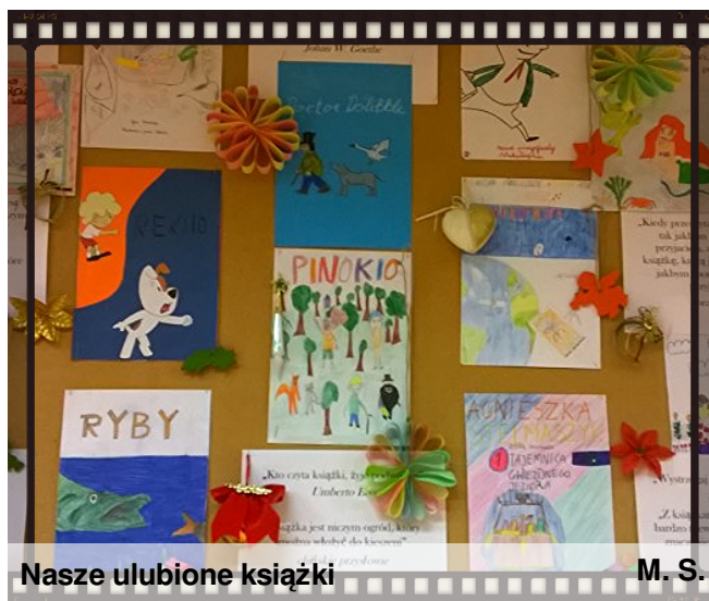
Nasze ulubione książki