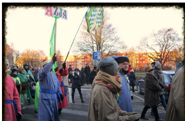
Uczestnicy reprezentowali trzy kontynenty