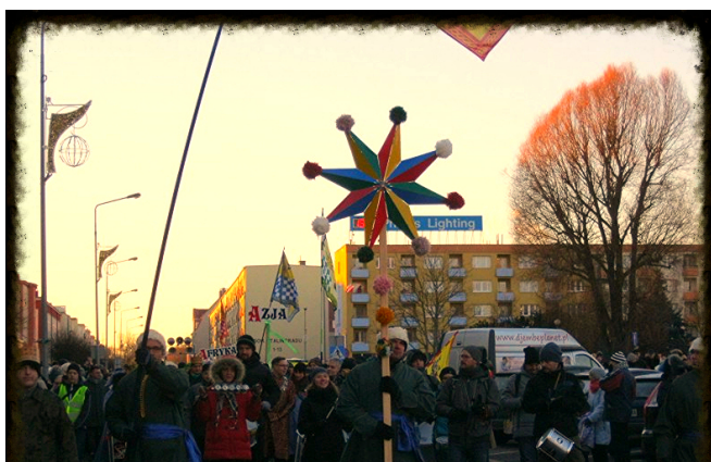
Za gwiazdą do Dzieciątka