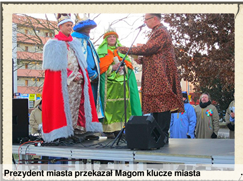
Prezydent miasta przekazał Magom klucze miasta

W piątek 6 stycznia 2017 roku w dzień Objawienia Pańskiego, podobnie jak w 500 innych miastach w Polsce, ulicami Piły przeszedł Orszak Trzech Króli. Był on organizowany po raz pierwszy w naszym mieście. Mimo siarczystego mrozu, nawet organizatorów zaskoczył tłum, który zebrał się na placu Zwycięstwa, a potem kroczył za orszakiem na plac Staszica. Parafie przygotowały stroje historyczno – ludowe: zielone, czerwone i niebieskie.