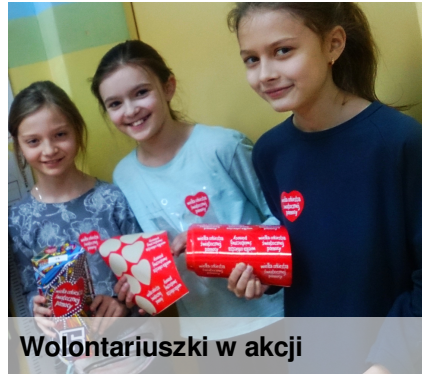
Wolontariuszki w akcji

Nasza szkoła włączyła się w ogólnopolską akcję Wielkiej Orkiestry Świątecznej Pomocy . Szkolny Wolontariat prowadził zbiórkę pieniędzy wśród uczniów i nauczycieli. Udało nam się zebrać 1457,16 zł! GRATULUJEMY!