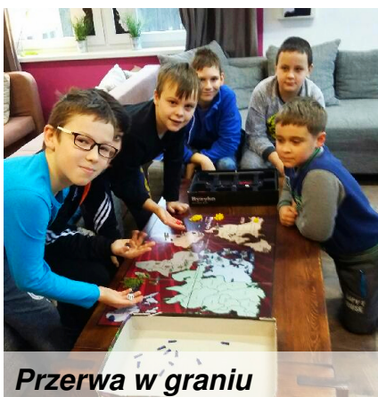
Przerwa w graniu