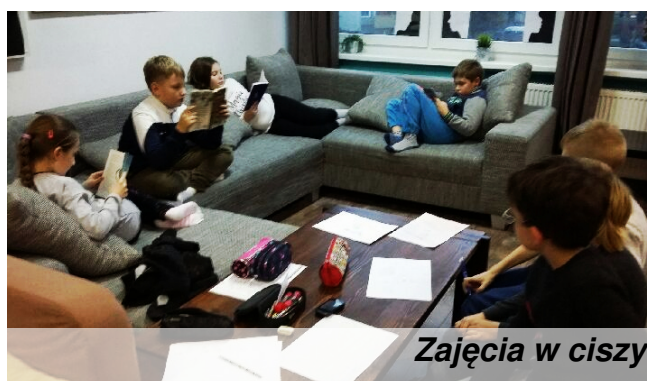
Zajęcia w ciszy