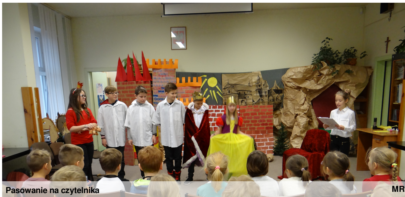
Pasowanie na czytelnika