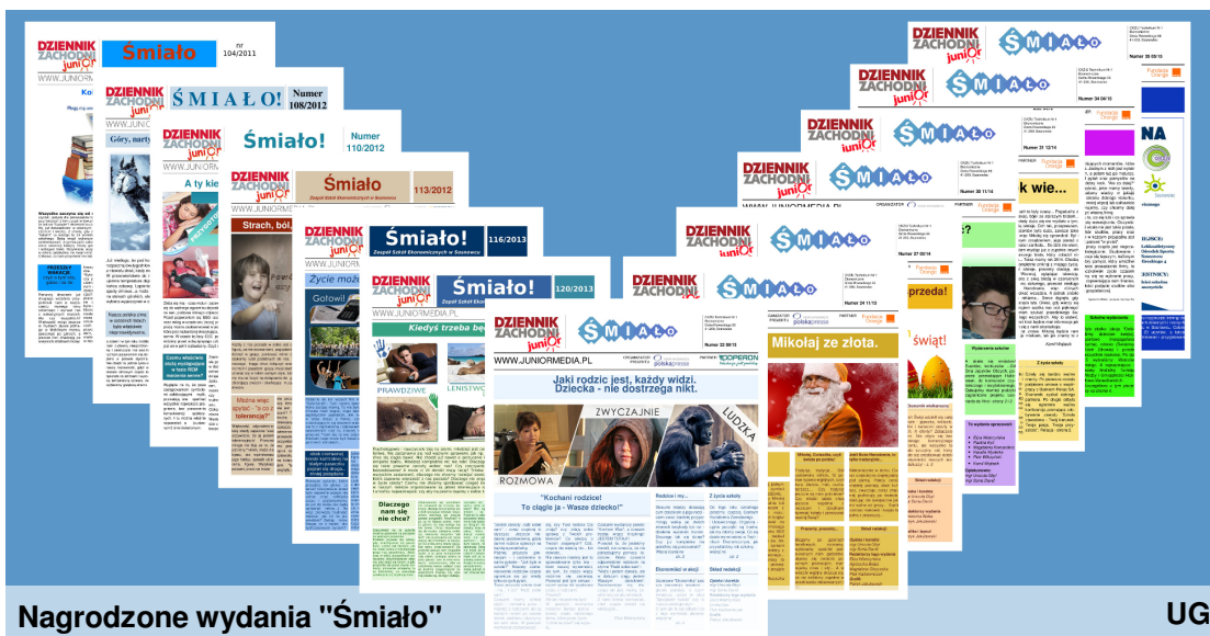
Nagrodzone wydania "Śmiało"

Organizatorami I Zagłębiowskiego Konkursu Gazetek Szkolnych było Gimnazjum nr 10 w Dąbrowie Górniczej oraz „Wiadomości Zagłębia”.