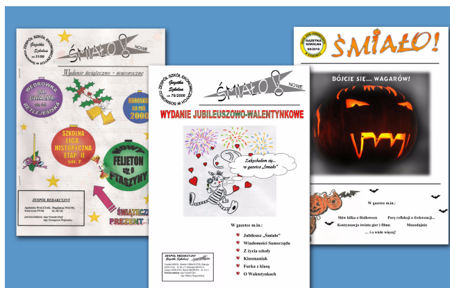
Co za postęp! Kolor w gazetce!

Wraz z pojawieniem się nowych możliwości technologicznych gazetka bardzo zmieniła swoją szatę graficzną. Wprowadzie druk całej kolorowej gazetki był niemożliwy ze względu na koszty (wtedy tusze do drukarek kosztowały krocie!), ale kolorowe pierwsza i druga strony były wstępem do dalszego rozwoju „Śmiało”. Gazetka od 1998 roku zmieniła swoje logo - posługiwała się nim do 97 numeru. Od 31 numeru każde noworoczne wydanie miało prezent.