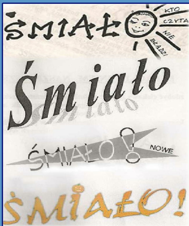
Tak wyglądały loga gazetki