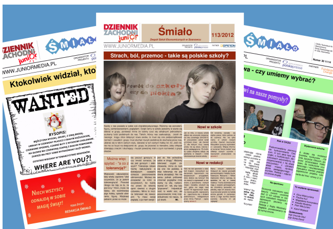
XXI wiek w "Śmiało"