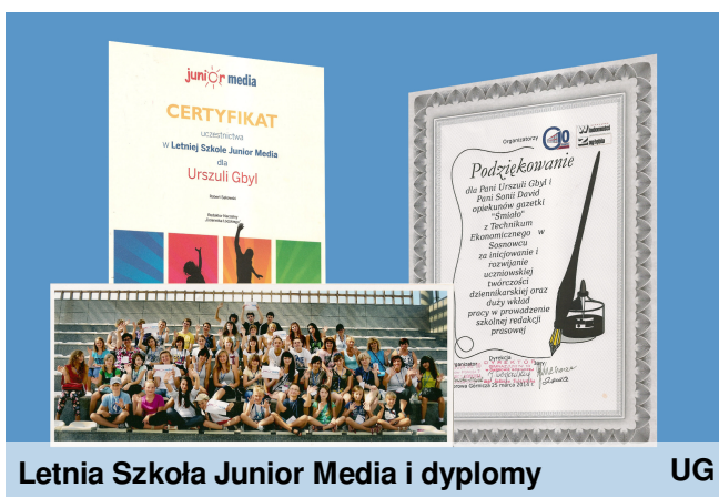
Letnia Szkoła Junior Media i dyplomy