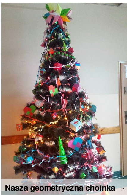
Nasza geometryczna choinka

22 grudnia w szkole mieliśmy klasowe wigilie, wszyscy składali sobie życzenia, w końcu jesteśmy taką szkolną rodziną. Klasa V nawet przygotowała dla rodziców Jasełka.