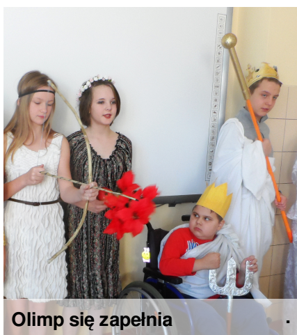
Olimp się zapelnia