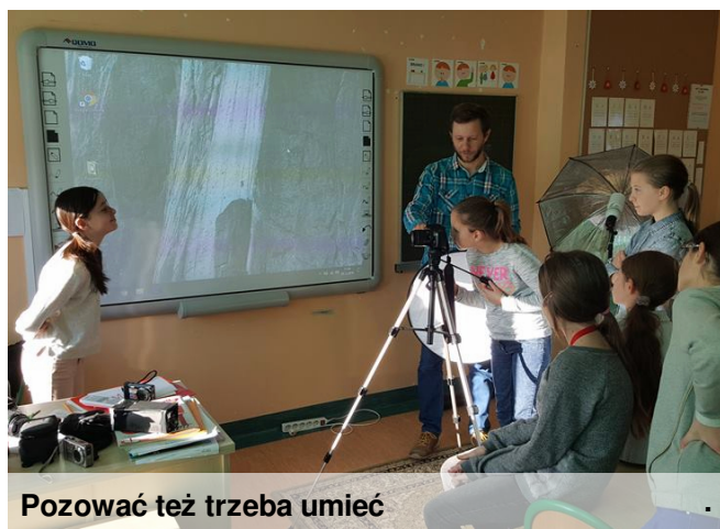
Pozować też trzeba umieć