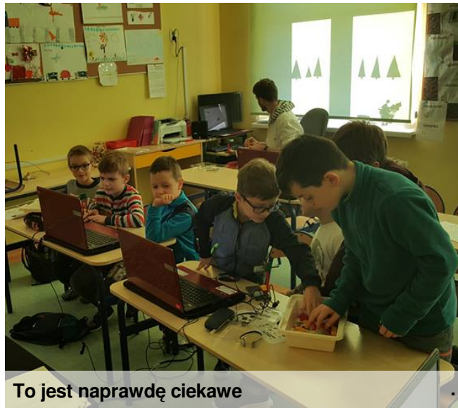
To jest naprawdę ciekawe