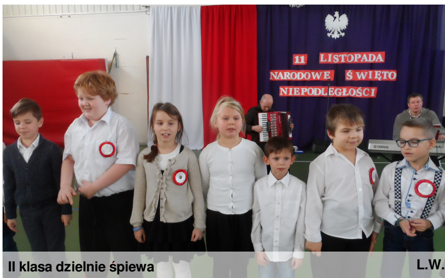
II klasa dzielnie śpiewa