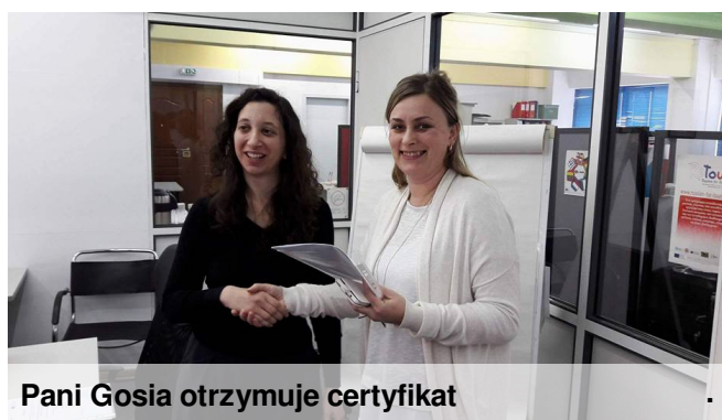
Pani Gosia otrzymuje certyfikat