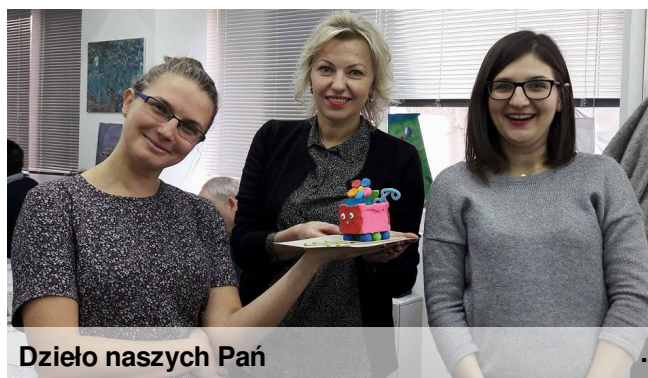
Dzieło naszych Pań