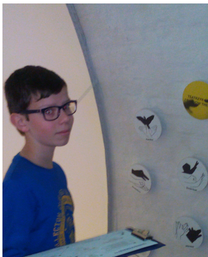
W świecie eksperymentów