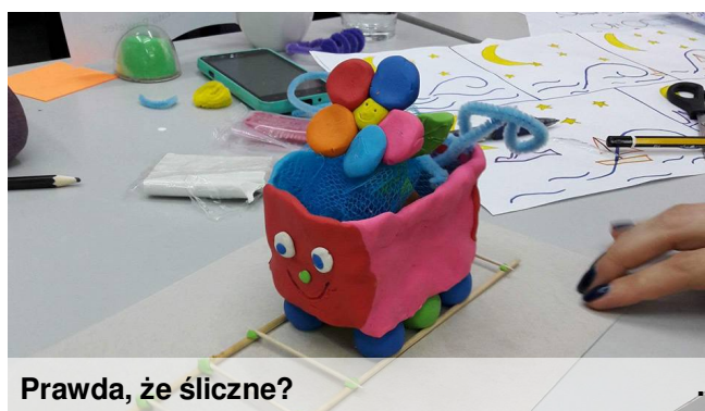
Prawda, że śliczne?