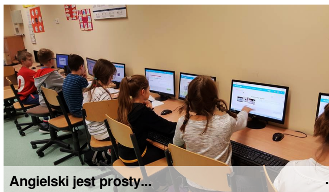
Angielski jest prosty...