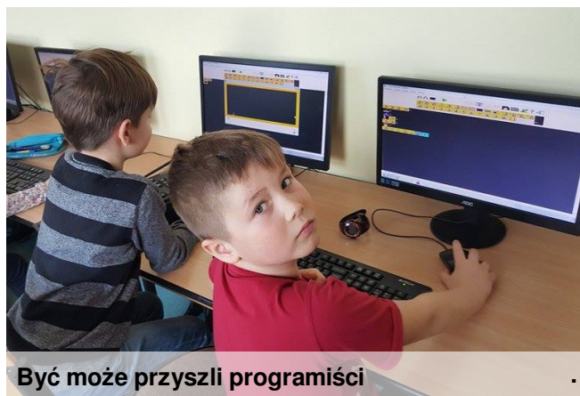
Być może przyszli programiści