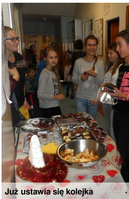
Już ustawia się kolejka