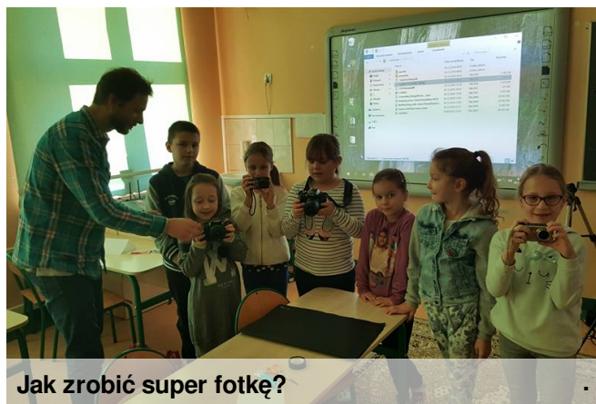
Jak zrobić super fotkę?