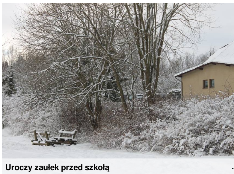
Uroczy zaulek przed szkołą