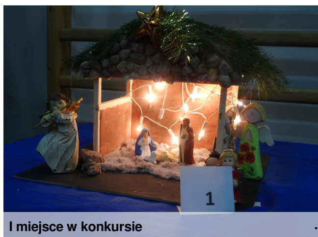
I miejsce w konkursie