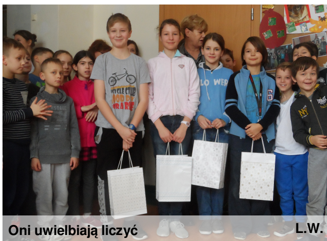
Oni uwielbiają liczyć