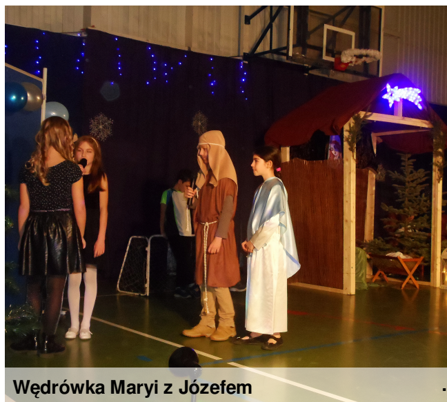
Wędrowka Maryi z Józefem