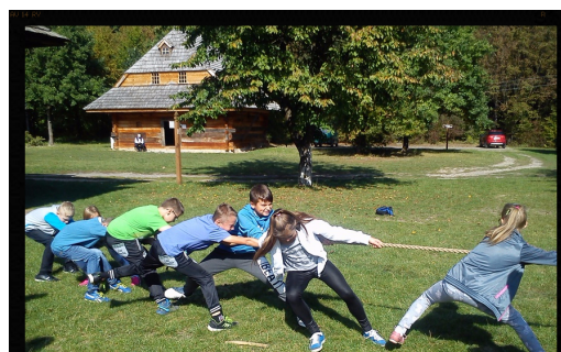
Przeciąganie liny to niezła frajda! Red.