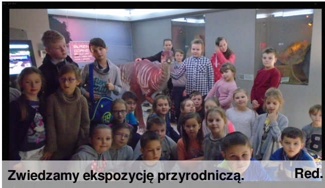
Zwiedzamy ekspozycję przyrodniczą. Red.