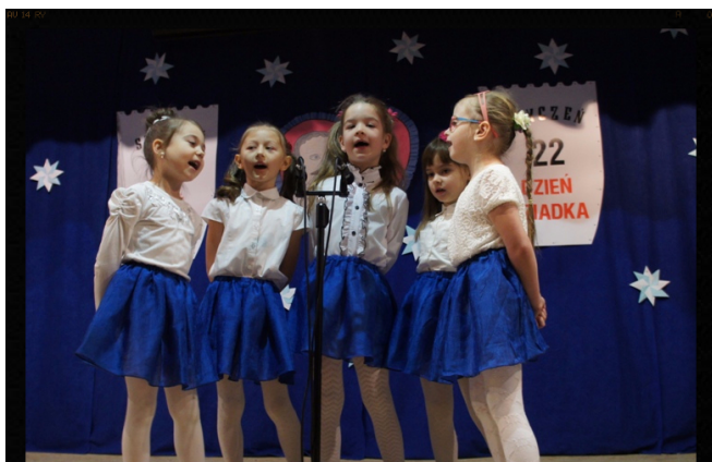
Dla Babci, dla Dziadka...