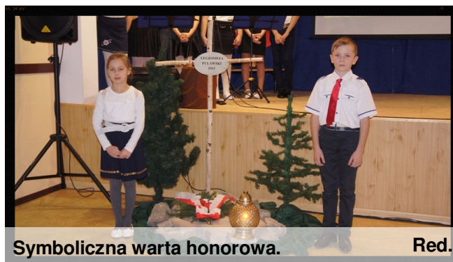
Symboliczna warta honorowa.