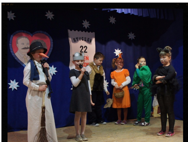
Zobacz Babciu nasz teatrzyk!