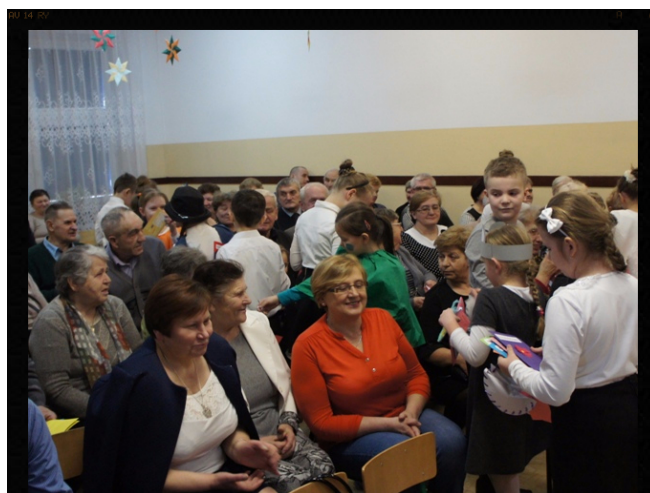
Życzenia dla drogich gości.