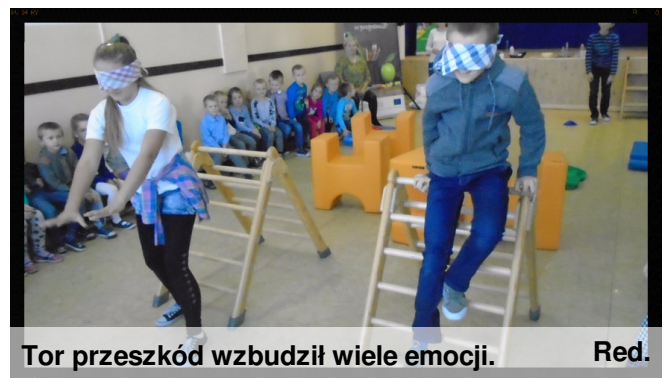
Tor przeszkód wzbudził wiele emocji.