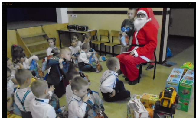
Mikołaj z wizytą u najmłodszych.