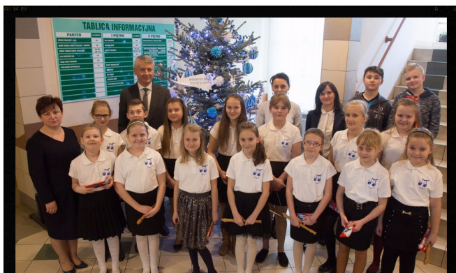
"Wesołe Nutki" i ... nasza dekoracja.