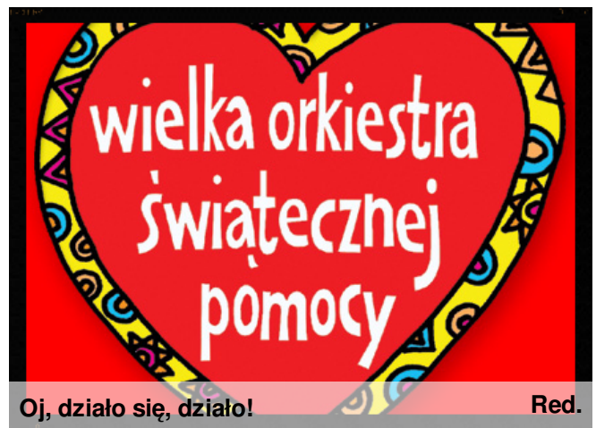
Oj, działa się, działa!