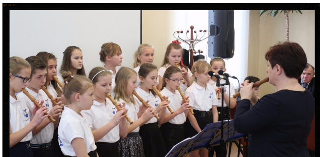
Występ w Mircu.