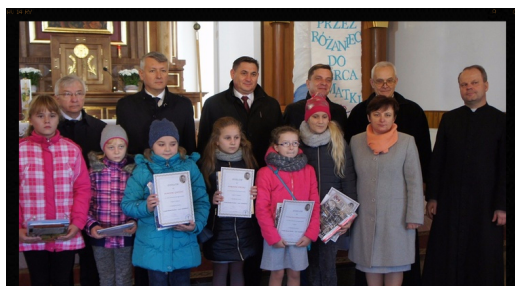
Laureaci konkursu.