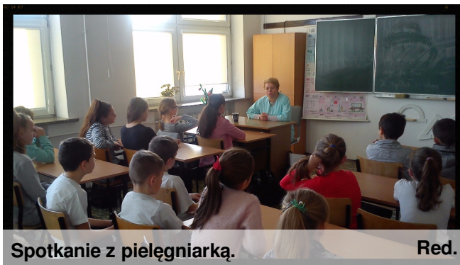
Spotkanie z pielęgniarką. Red.