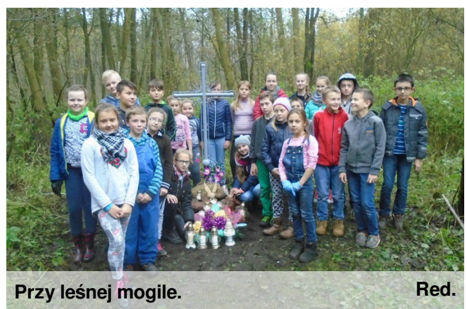
Przy leśnej mogile.