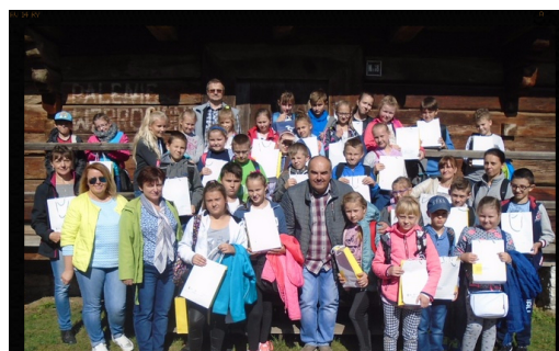
Nasza wycieczkowa grupa. Red.

27 września uczniowie klas III-VI wyjechali do Tokarni na Sejmik Dziecięcy województwa świętokrzyskiego. Wzięli tam udział w imprezie „Spotkanie z tradycją”. Wielu emocji dostarczył „Questing” – gra terenowa, której uczestnicy, wędrując w skansenie szlakiem zabytków kultury ludowej i kierując się zbieranymi po drodze wskazówkami, szukali ukrytego „skarbu”. W zorganizowanych dla dzieci konkursach można się było wykazać wiedzą o regionie, jego tradycjach i historii, a później wyszaleć się w dawnych grach i zabawach. Grele, toczenie fajerki, wyścigi w workach, piłkarski mecz w „szmaciankę”... Okazało się, że doskonałej rozrywki może dostarczyć nie tylko komputer.