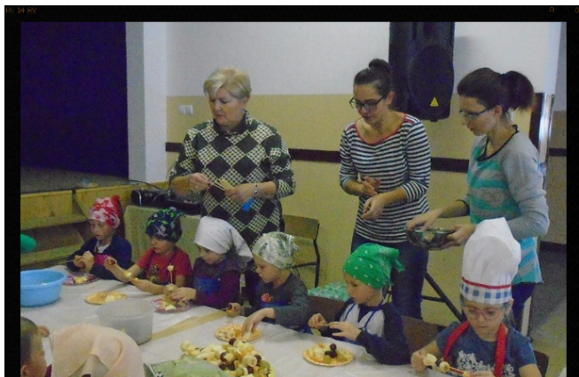
Młodzi kucharze w akcji!