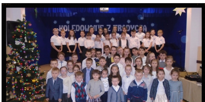
Płyn kolędo, płyn...