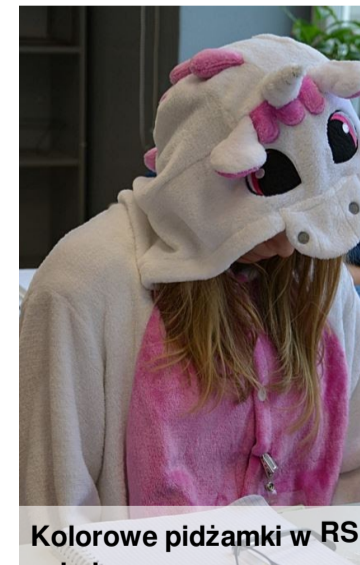
Kolorowe piżamki w RS