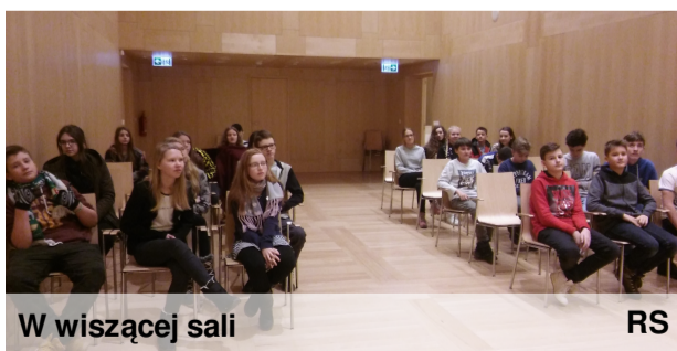
W wiszącej sali