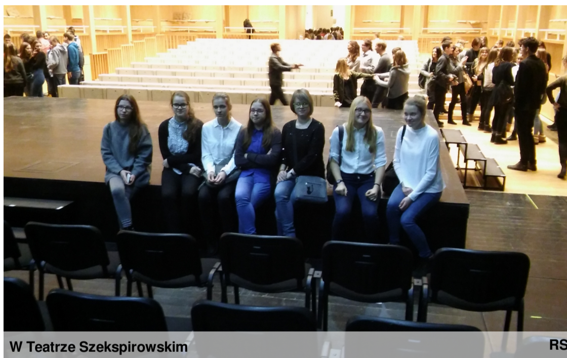
W Teatrze Szekspirowskim