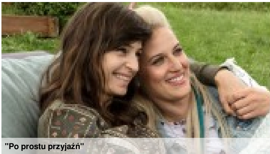
"Po prostu przyjaźń"

Drugi film jaki mogę państwu polecić to komedia polska „Po prostu przyjaźń”. Ma on różne recenzje, pozytywne i negatywne. Moim zdaniem każdy z nas będzie miał inną opinię i mimo tych negatywnych warto wybrać się do kina. Film powiada o paczce przyjaciół, która jest ze sobą na dobre i na złe. Jednak pewnego dnia niespodziewanie Alina wraz z Marianem wygrywają wielkie pieniądze. Oboje będą musieli się nimi podzielić. Ciekawe, jak im się to uda. Jedną z ich przyjaciółek Ivankę, która jest singielką i menadżerką na wysokich obcasach postanawia zająć w ciąży. Ma jej w tym pomoc serdeczny przyjaciel. Czy odważy się na taki wielki krok? Natomiast Filip ryzykuje karierę dla zwariowanej Jadźki. Profesor, którego gra Krzysztof Stelmachyć zadecyduje, czy złamie zasady tylko jakie? Również paczka przyjaciół wyruszy w góry, gdzie ich życie wywróci się do góry nogami. Dlaczego? Bohaterowie będą mieli naprawdę trudne dylematy do rozstrzygnięcia. Czy dla nich okażą się ważniejsze pieniądze czy lojalność? „ Przyjaźń czy miłość?” A może „prawda czy kłamstwo?” A przede wszystkim, jak im się to uda przeżyć? Na te pytania można znaleźć odpowiedź, idąc na ten film do kina.