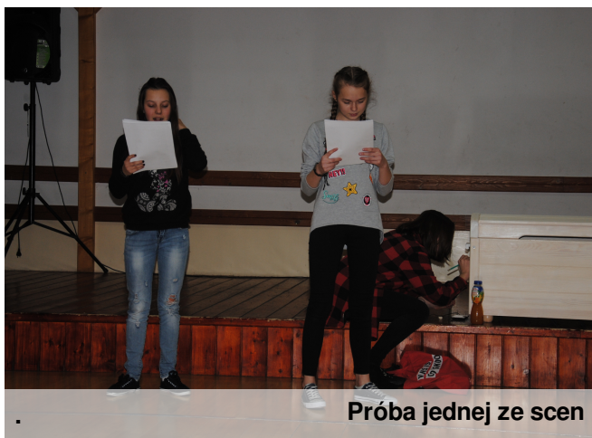
Próba jednej ze scen