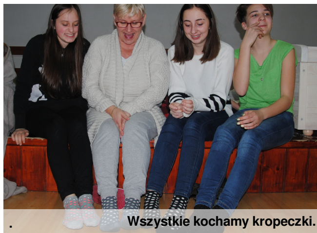
Wszystkie kochamy kropeczki.