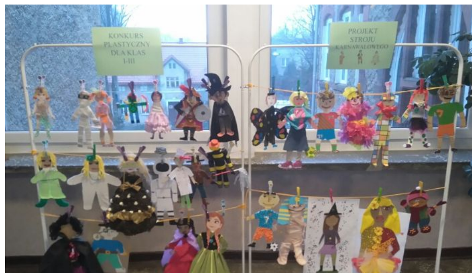
Projekty strojów karnawałowych