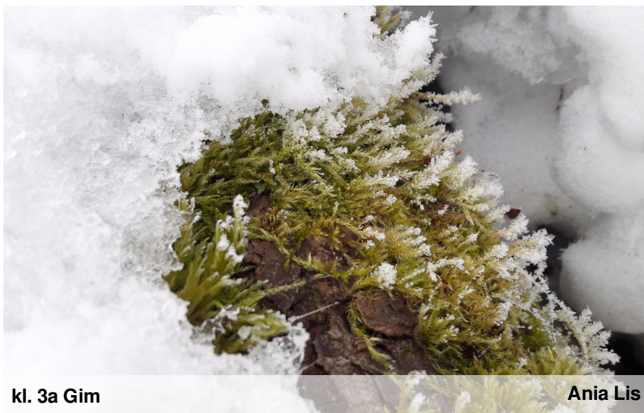
kl. 3a Gim

Dziękujemy za udział w konkursie fotograficznym: Ferie zimowe 2017 w obiektywie . Wyróżnione zdjęcia zamieszczamy w naszej gazetce.