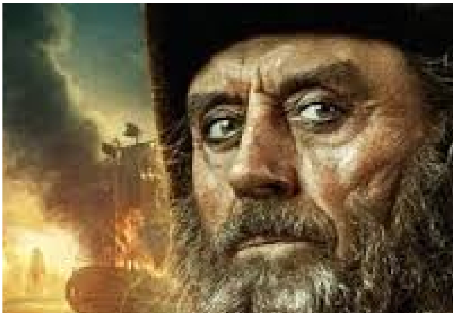
Pirat Czarnobrody :)