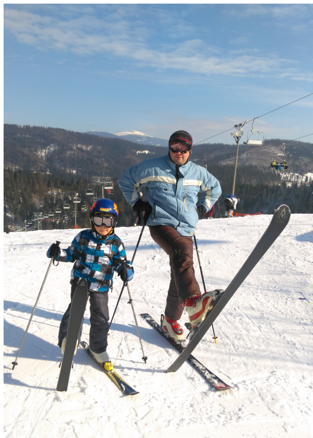
kl. 1 SP