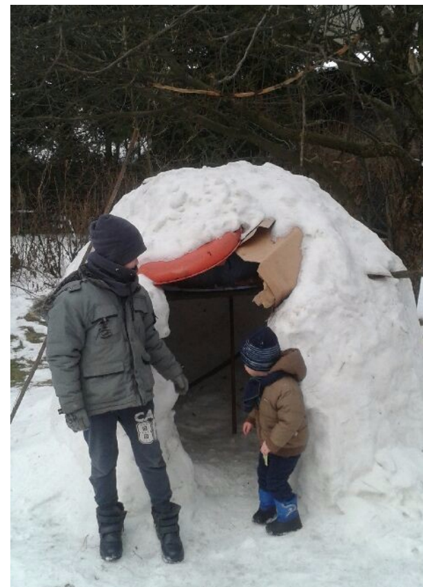
kl. 3b SP