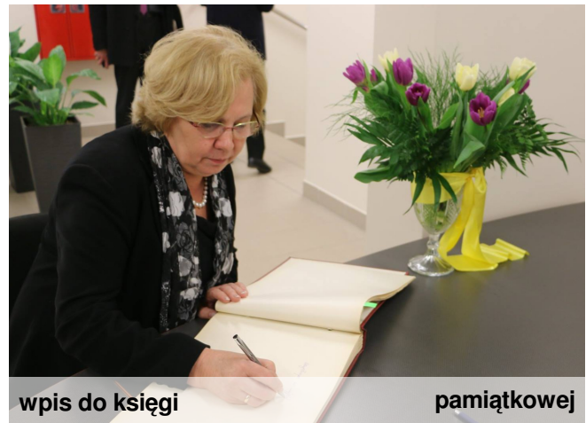
wpis do księgi