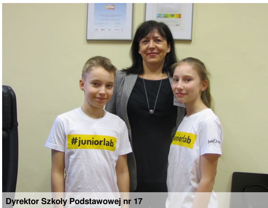
Dyrektor Szkoły Podstawowej nr 17

Redaktorzy: Ile lat pracuje Pani w tej szkole?