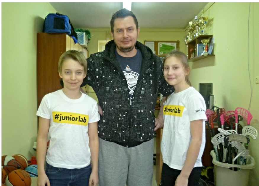
Nauczyciel wychowania fizycznego z redaktorami

R.:Jakie cechy charakteru ceni Pan u ucznia i dlaczego akurat te?