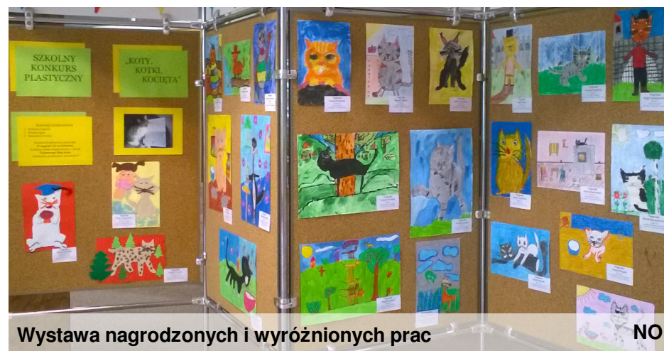
Wystawa nagrodzonych i wyróżnionych prac