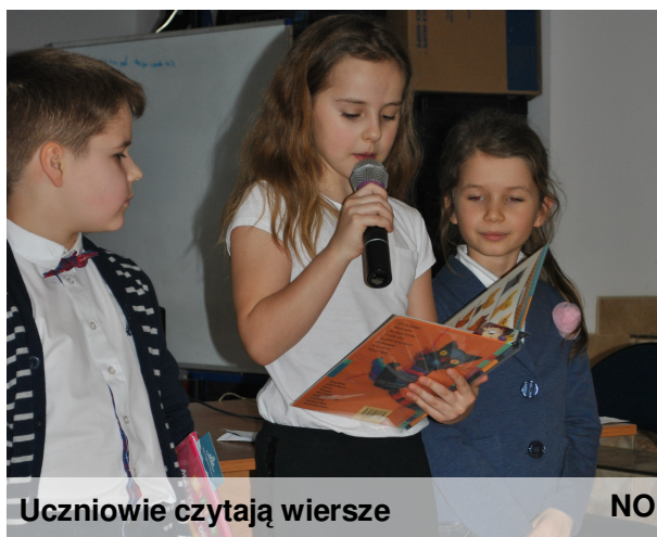
Uczniowie czytają wiersze