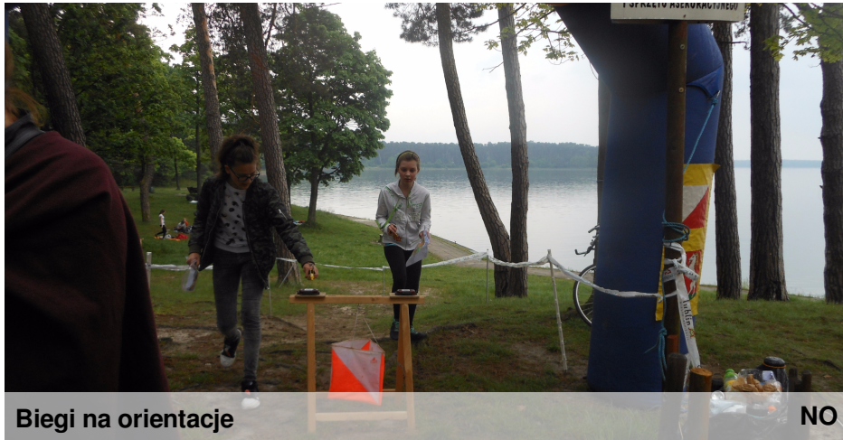
Biegi na orientacje