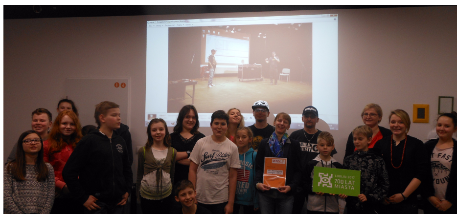
Beatbox'owa lekcja historii