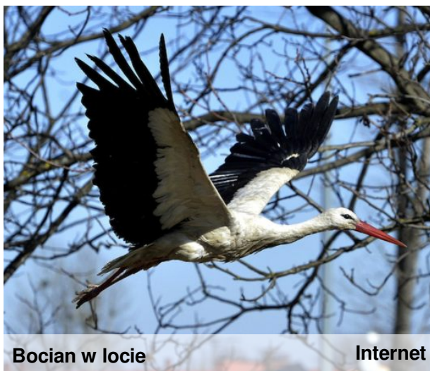
Bocian w locie

Gdy wstajemy szybko z rana, moja mama jest roześmiana. Wspólnie przygotowujemy śniadanie, pyszna zapiekanka jest na nie. Potem się ubieramy i do szkoły się zbieramy. Gdy mama odbiera mnie ze szkoły, mam wtedy humor wesoły. Razem obiad przygotowujemy, potem wspólnie go jemy. W sobotę do parku idziemy, wiewiórki i pawie obserwujemy.