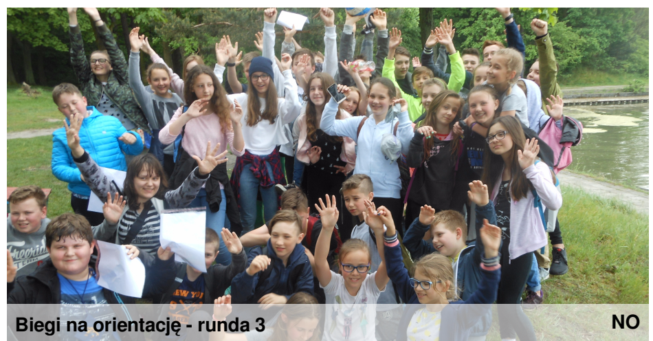
Biegi na orientację - runda 3