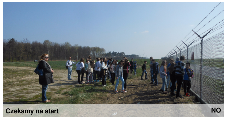
Czekamy na start