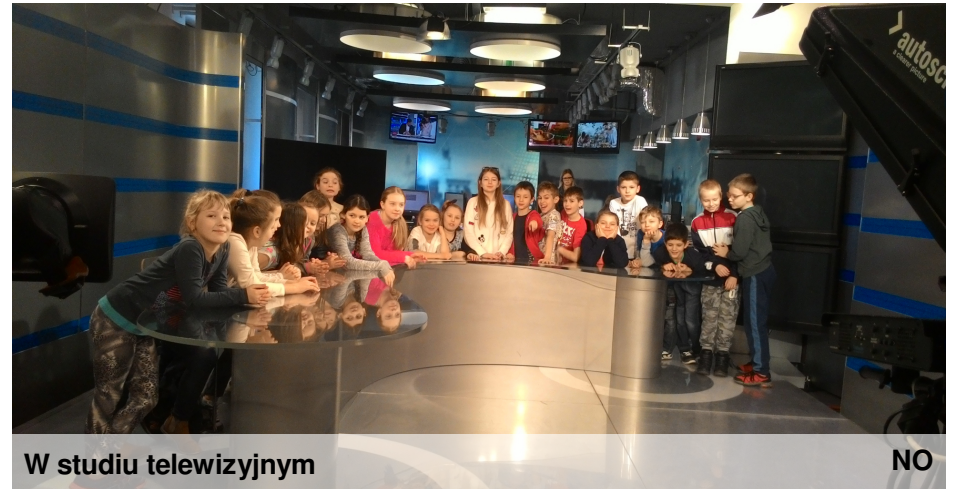
W studiu telewizyjnym