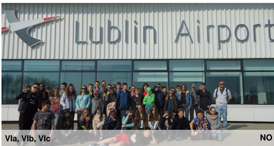
VIa, VIb, VIc