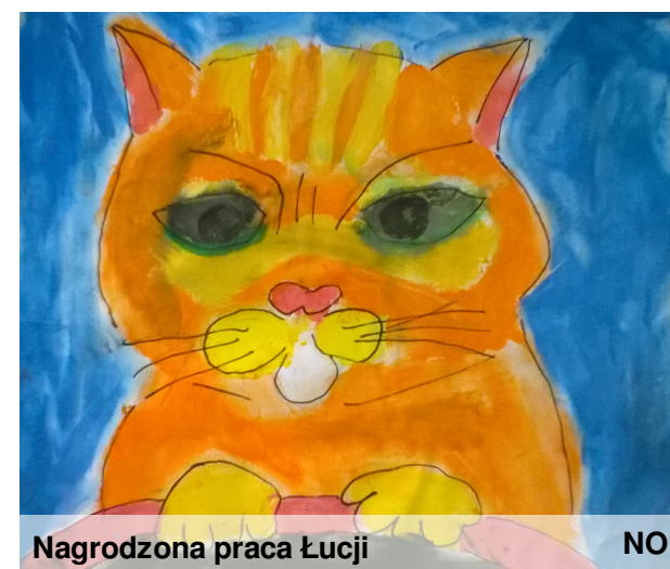
Nagrodzona praca Łucji