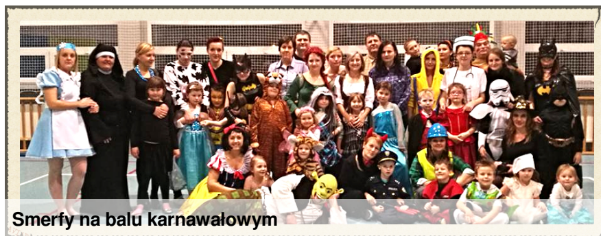
Smerfy na balu karnawałowym

Dziś wszyscy się przebieraia - nauczyciele, uczniowie i rodzice.