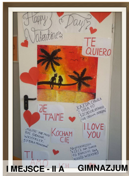
I MIEJSCE - II A GIMNAZJUM

Były tak romantyczne, że komisja miała problemy z wyborem najlepszych z najlepszych. Ale ponieważ byli w niej przedstawiciele obu płci, doszli do porozumienia. W tym konkursie z gimnazjum pierwsze miejsce zajęła 2A, drugie 2B, trzecie 3C. Ze szkoły podstawowej: miejsce I otrzymała klasa 6A, miejsce II ex aequo 6B,5B, miejsce III 6D,4B,5C.