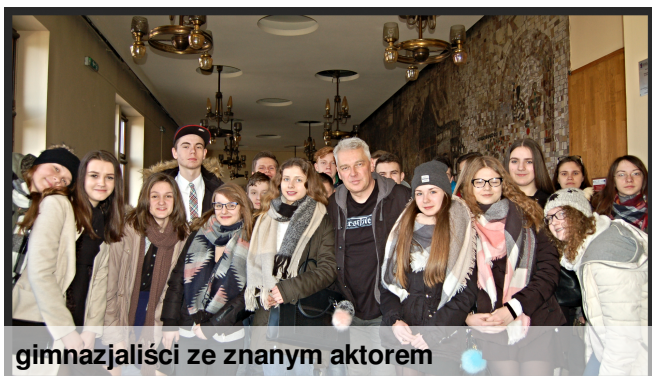
gimnazjaliści ze znanym aktorem