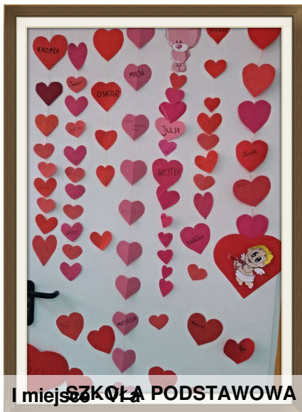
I miejsce - SZKOŁA PODSTAWOWA