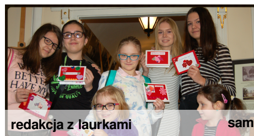
redakcja z laurkami

Nasza redakcja w niedzielę, 12 lutego, uczestniczyła w warsztatach plastycznych pn. „Walentynki z wyobraźnią” zorganizowanych w Muzeum Zagłębia w Będzinie. Dziewczynki wykonały laurki walentynkowe techniką scrapbookingu.