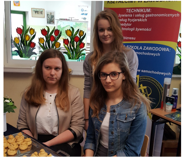
Targi w Rozprzy