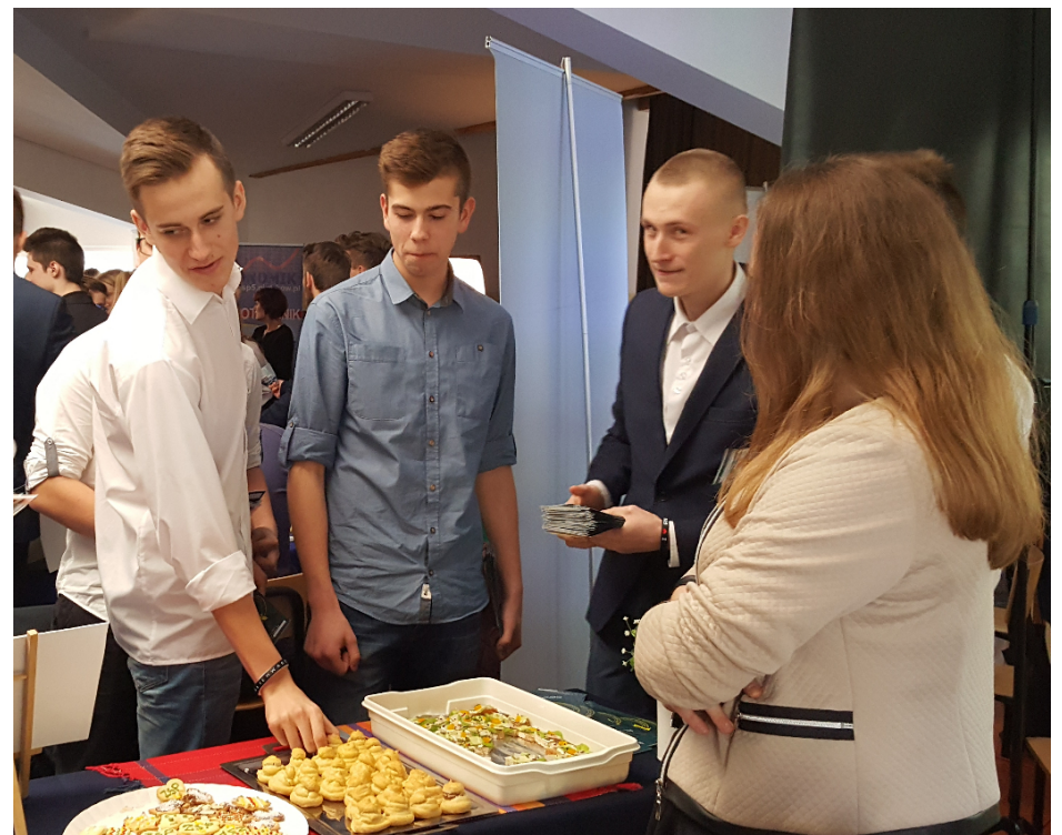
Targi w Rozprzy