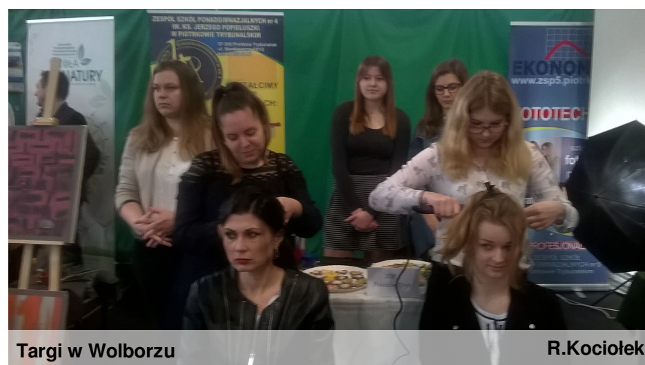
Targi w Wolborzu