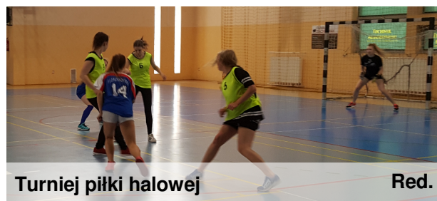
Turniej piłki halowej