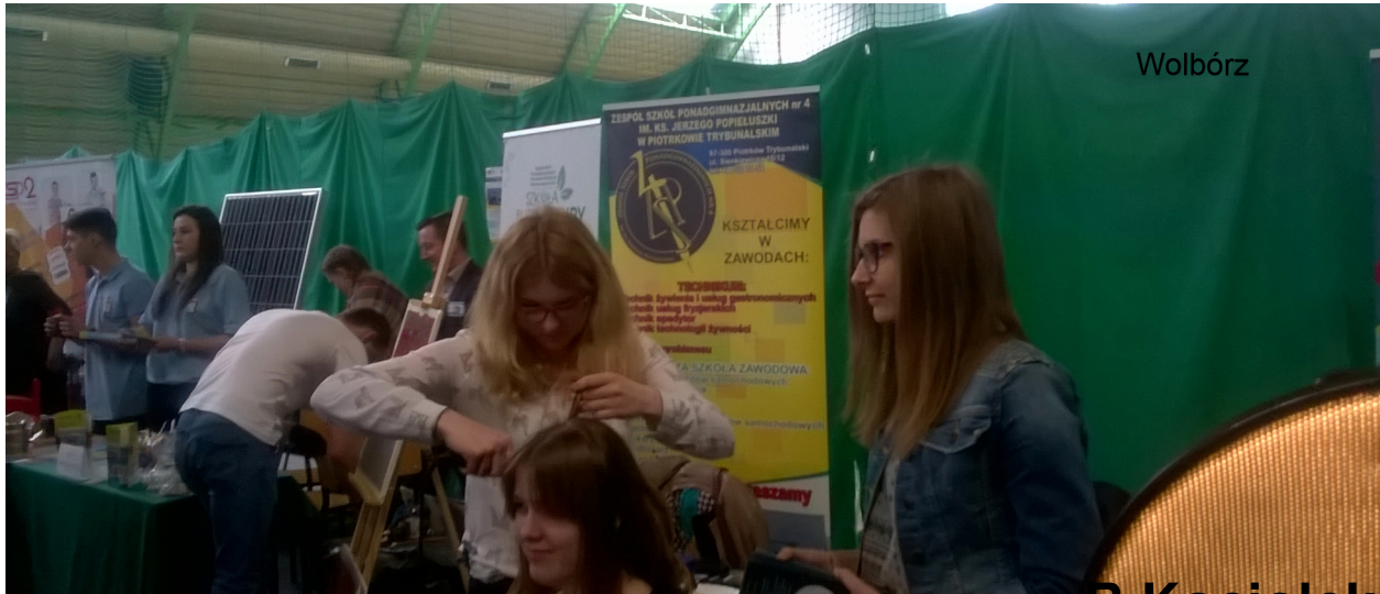
Targi w Wolborzu