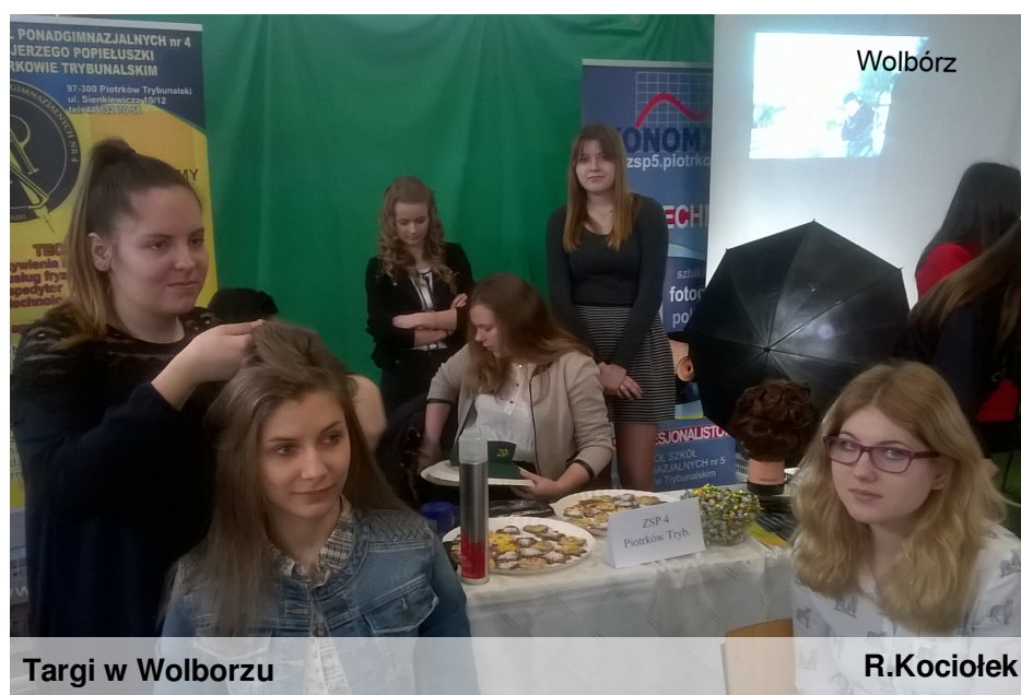
Targi w Wolborzu