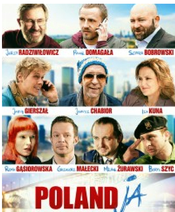
Plakat „KOMEDIA NA CZASIE I Z PAZUREM! Internet

Marzec już pierwszego dnia przywitał nas wiosennym ciepłem i słońcem. Nie można było tego przyjąć z obojętnością, należało tylko znaleźć pretekst, który dałby pretekst do wydostania się ze szkolnych murów. Tak zrodził się pomysł, by wyjść do kina.