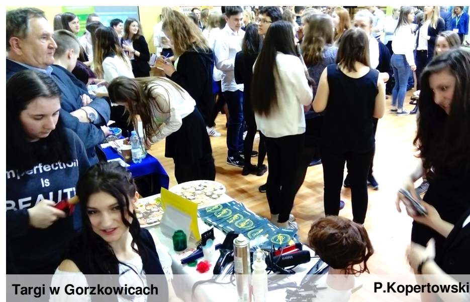
Targi w Gorzkowicach