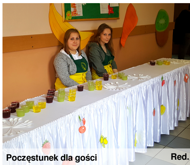
Poczęstunek dla gości