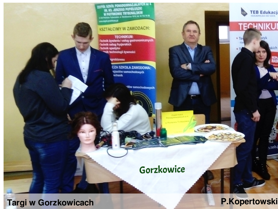
Targi w Gorzkowicach

Przygotowane przez nas stoisko cieszyło się zainteresowaniem. Zagląający do nas gimnazjaliści mogli skorzystać z usług fryzjerskich i poczęstować się ciasteczkami, upieczonymi specjalnie na targi.