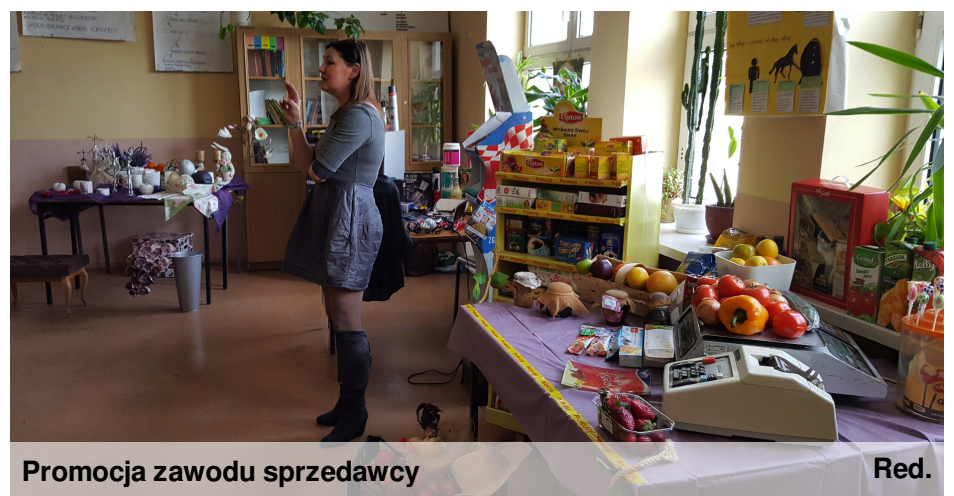
Promocja zawodu sprzedawcy