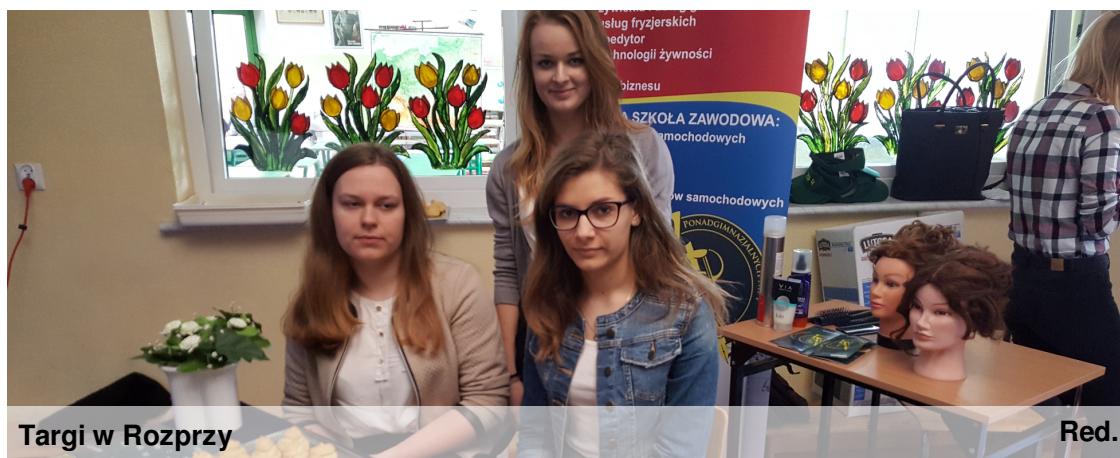
Targi w Rozprzy