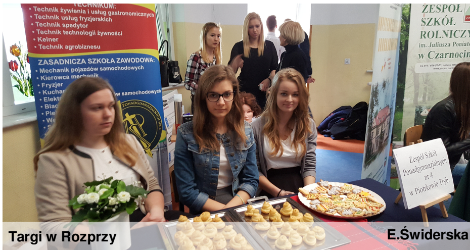
Targi w Rozprzy