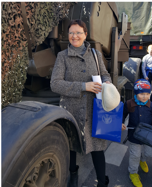
Przy wozie bojowym