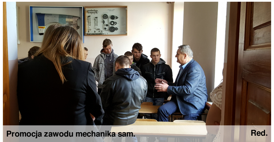
Promocja zawodu mechanika sam.