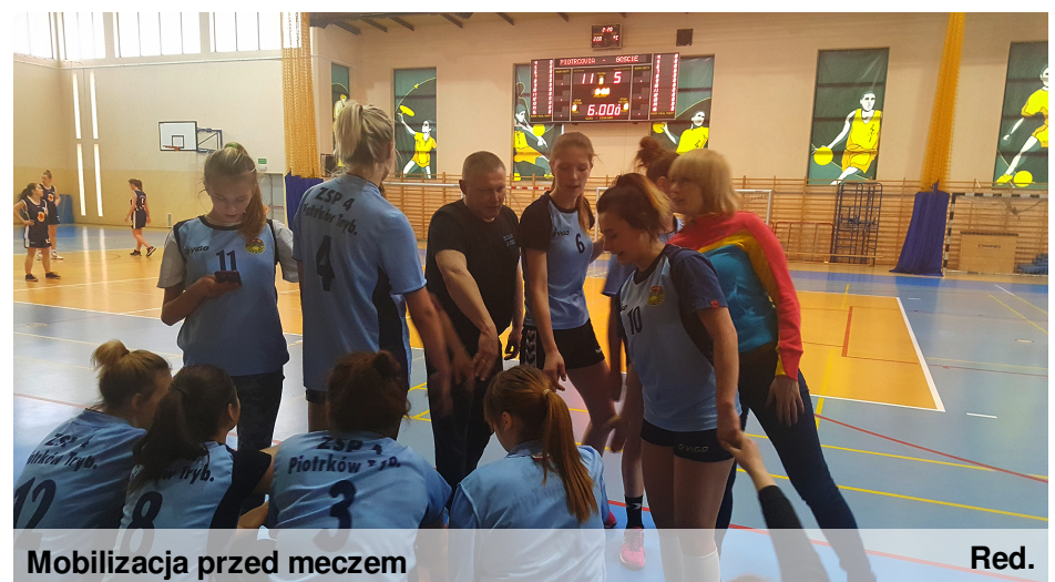
Mobilizacja przed meczem