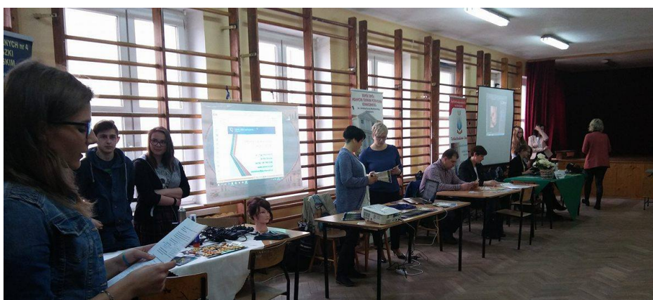
Targi w Rozprzy