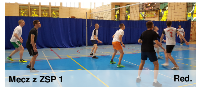
Mecz z ZSP 1

Drużyna siatkarzy dostarczyła nam niesamowitych emocji w czasie turnieju, który się odbył 16 marca. Każdy mecz rozgrywany był na wyrównanym poziomie. Kibice dopingowali nasz zespół na stojąco. Nie udało się przejść do finału, jednak gra była tak dobra, że publiczność wychodziła z meczu w pozytywnych nastrojach. Zespół siatkarzy posiada duży potencjał, co rozbudza nasze nadzieje na zwycięstwo w najbliższych zawodach.