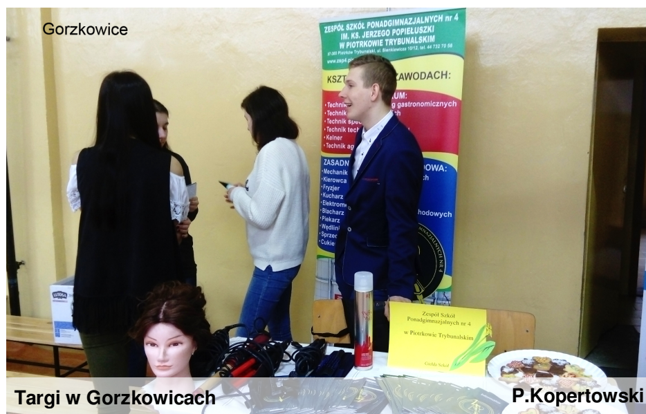
Targi w Gorzkowicach