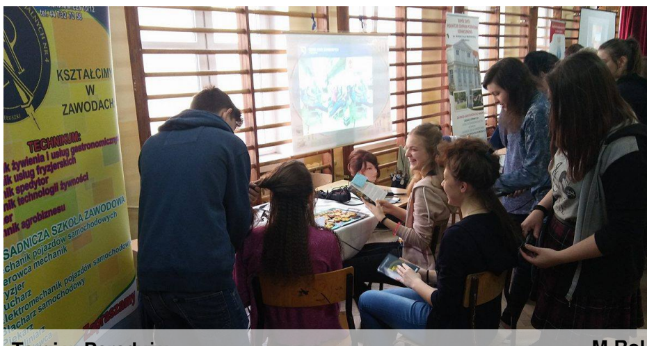
Targi w Rozprzy