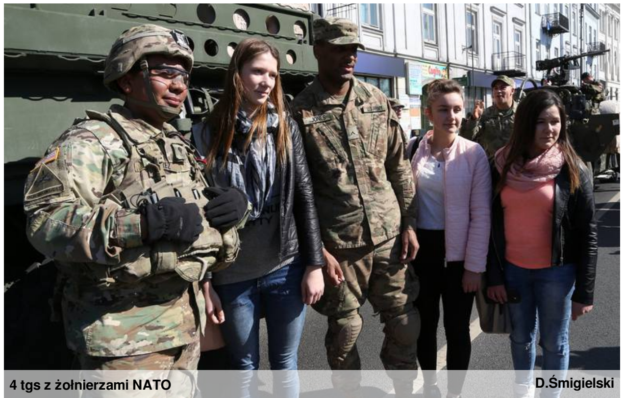
4 tgs z żołnierzami NATO