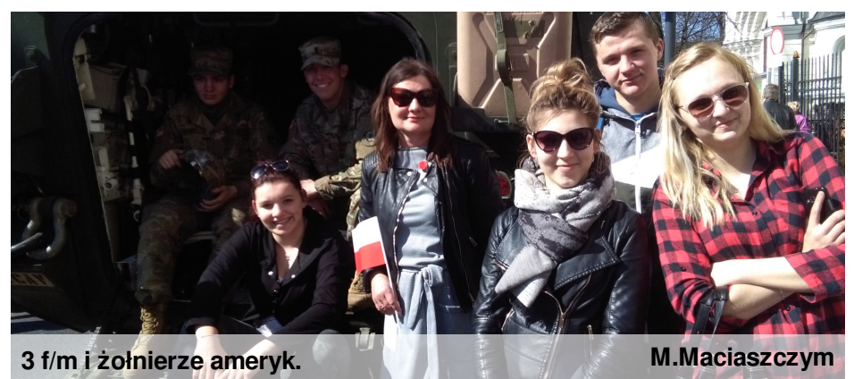
3 f/m i żołnierze ameryk.