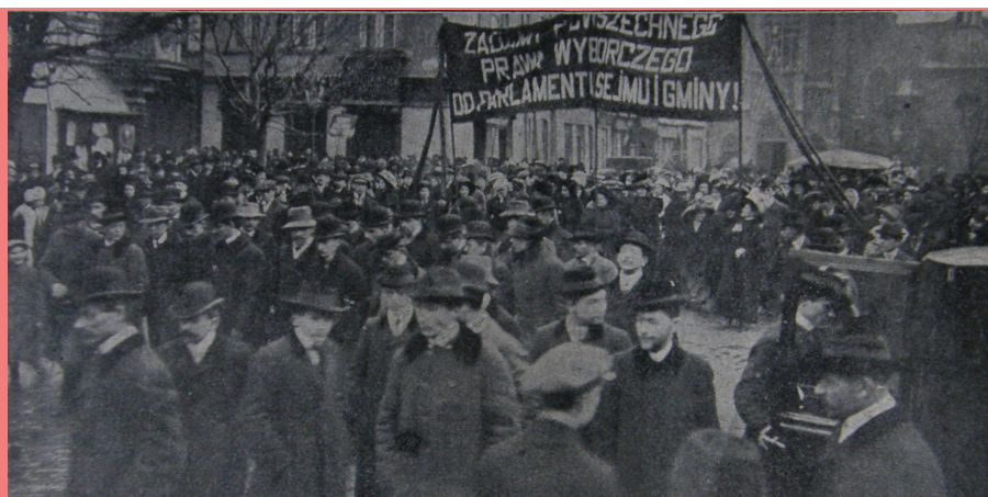
Sufrażystki w Krakowie – Dzień Kobiet 1911 r.

Skąd się wziął Dzień Kobiet? Od kiedy jest obchodzony w Polsce? Święto Kobiet w Polsce upowszechniło się w czasach PRL-u, choć na świecie obchodzi się je od 1910 roku. A jego symbolem jest czerwony goździk to jednak z założenia Międzynarodowy Dzień Kobiet jest uczczeniem pamięci sufrażystek. Walczyły one o równouprawnienie kobiet, równe traktowanie w pracy i taką samą wypłatę za jednakowo wykonaną pracę. Początki obchodów tego święta związane są ze strajkami w Stanach Zjednoczonych. Podczas jednego z nich, w 1909 roku kobiety sprzeciwiające się uciskowi w firmie, zostały zamknięte w fabryce, gdzie wybuchł pożar. Zginęło w nim 126 kobiet. Dlatego od 1910 roku obchodzi się Dzień Kobiet jako uczczenie pamięci i poświęcenia tych kobiet. Ustanowiła go Międzynarodówka Socjalistyczna w Kopenhadze. Z założenia Dzień Kobiet miał służyć utrwalaniu idei równości. W większości krajów te święto obchodzone jest 8 marca, choć są wyjątki – w Tunezji obchodzi się je 13 sierpnia. Data – początek marca – związana jest z rzymskimi obchodami Matronaliów, święta macierzyństwa, płodności i pierwiastka żeńskiego w naturze. Wtedy też kobiety były traktowane w sposób wyjątkowy, ponieważ dawano im prezenty i spełniano ich życzenia. Współcześnie Dzień Kobiet respektują kraje takie, jak Albania, Białoruś, Bośnia i Hercegowina, Brazylia, Chiny, Chorwacja, Cypr, Kuba, Portugalia, Rosja, Słowacja, Szwecja, Ukraina, Indie, Węgry, Francja i oczywiście Polska.