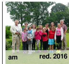
am red. 2016