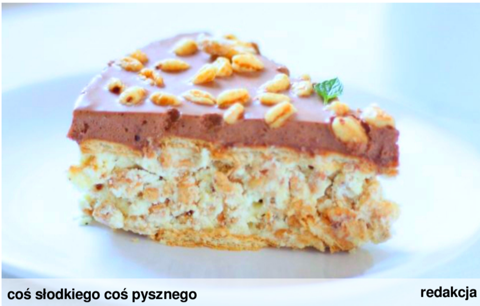
coś słodkiego coś pysznego