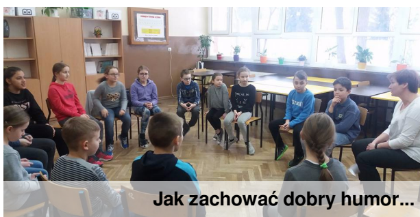
Jak zachować dobry humor...