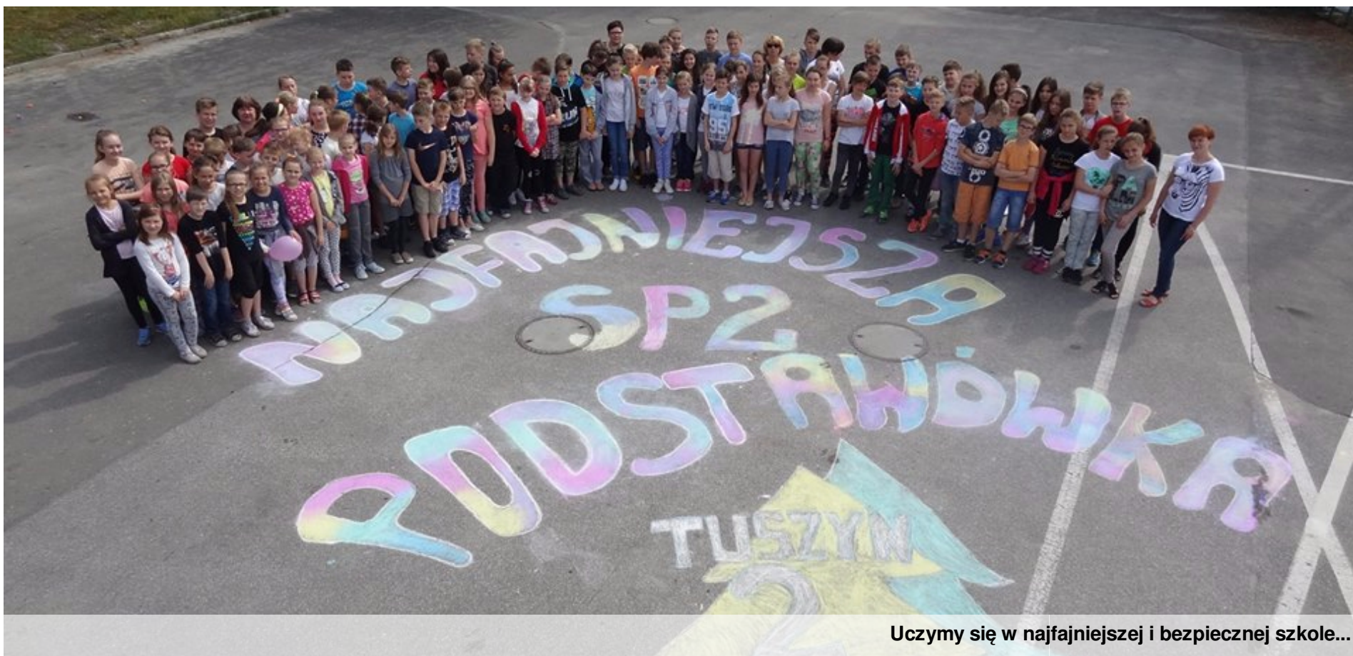
Uczymy się w najfajniejszej i bezpiecznej szkole...