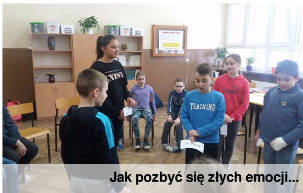
Jak pozbyć się złych emocji...