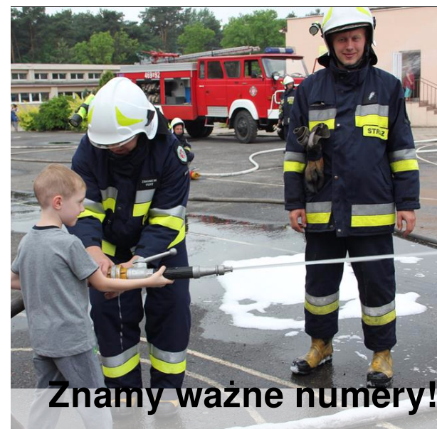
Znamy ważne numery!

Znam już na pamięć numery alarmowe. Gdy zajdzie potrzeba, w głowie są gotowe. 997 - tu policję się wzywa, 998 - straż pożarna przybywa, 999 - ważne życie i zdrowie. Jedzie na sygnale szybkie pogotowie. W razie zagrożenia korzystam