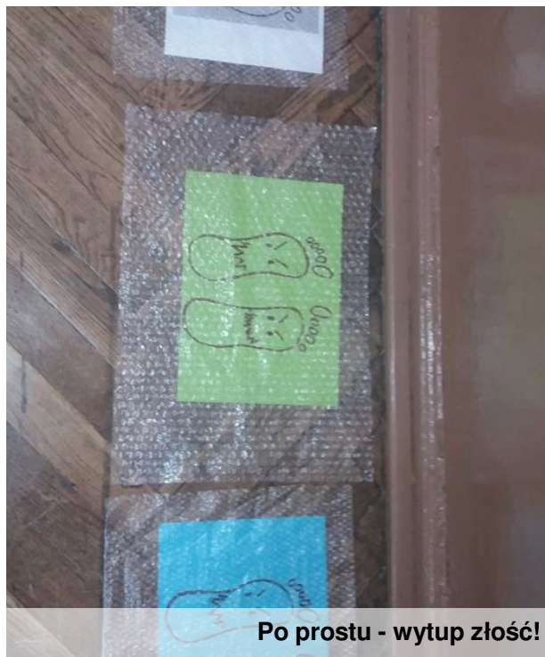
Po prostu - wytup złość!