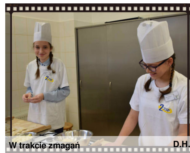
W trakcie zmagania