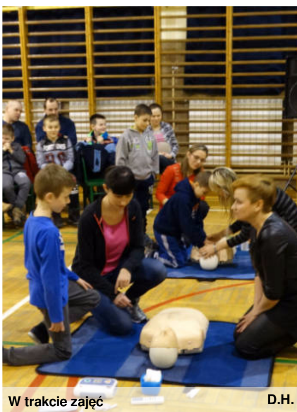
W trakcie zajęć