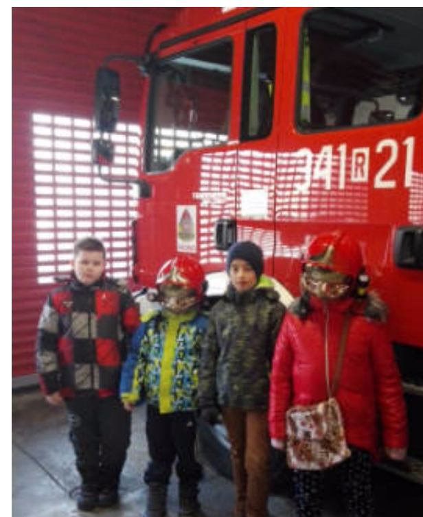
Gotowi do akcji