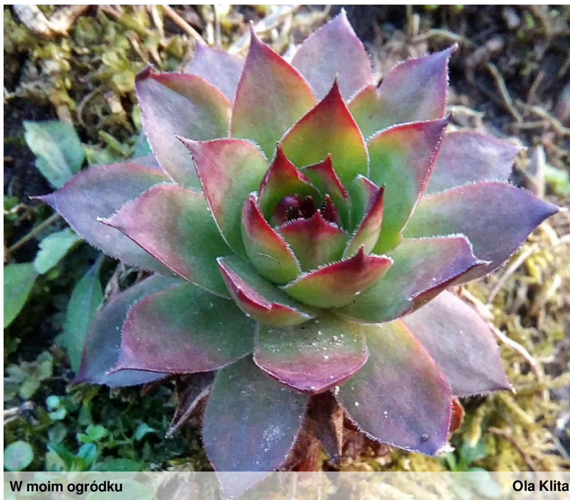
W moim ogródku