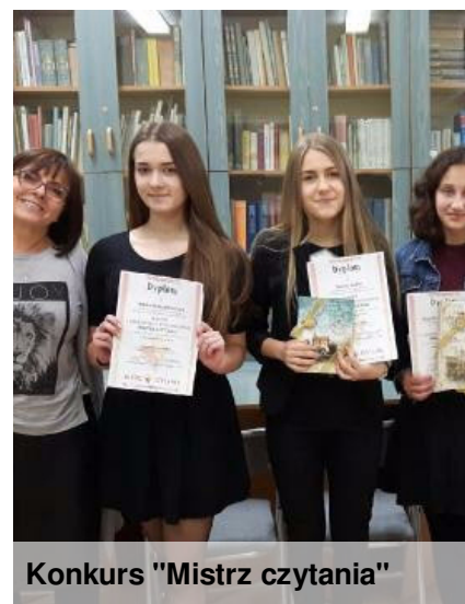
Konkurs "Mistrz czytania"