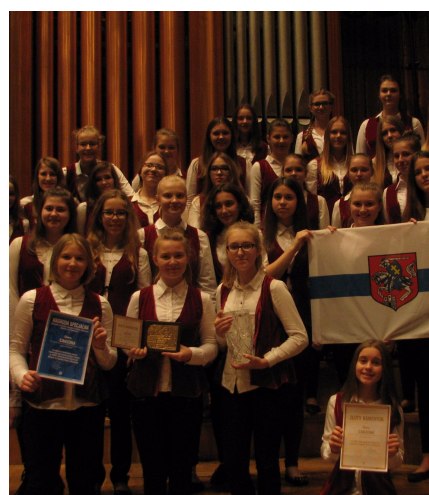
"Złoty kamerton" 2016 r.