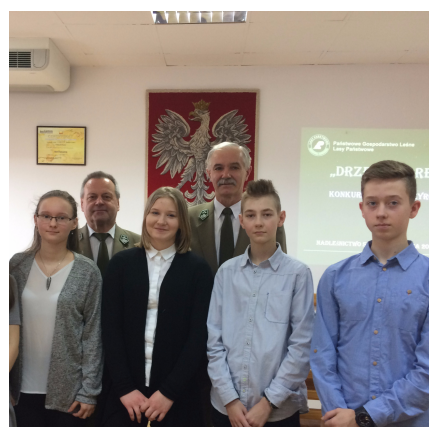
Konkurs drzewa i drewno