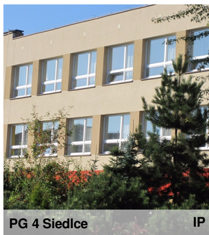
PG 4 Siedlce