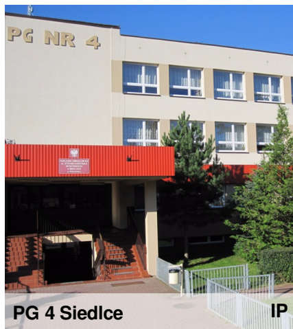
PG 4 Siedlce

Zapraszamy na dni otwarte 27 marca, od godziny 17:00!