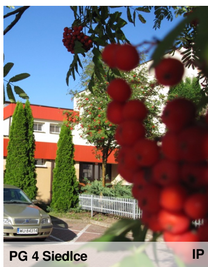
PG 4 Siedlce