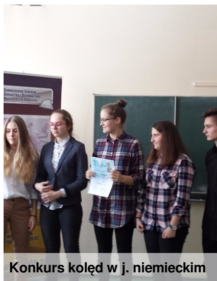
Konkurs kolęd w j. niemieckim