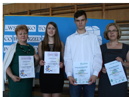
Konkurs fizyczny i chemiczny

Inne sukcesy w tym roku to: I miejsce, w konkursie "Mistrz czytania", I miejsce w konkursie kolęd w języku niemieckim, III miejsce w konkursie recytatorskim "Słowo - dar i tajemnica", I miejsce w XII Przeglądzie Małych Form Teatralnych.