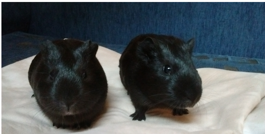
Dodał: Michał L.