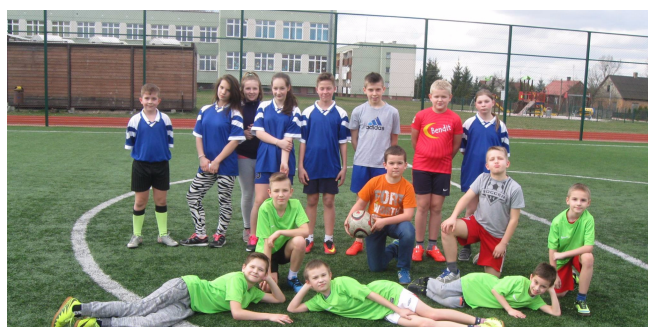
Szkolny klub sportowy

Pierwszego dnia wiosny - 21 marca br. - odbył się szkolny etap turnieju rowerowego Bezpieczeństwo w Ruchu Drogowym . Uczniowie klas V, VI oraz gimnazjum próbowali przejechać specjalnie przygotowany tor przeszkód, nie zdobywając punktów ujemnych, a następnie pisali test z wiedzy o ruchu drogowym. Nad prawidłową oceną toru przeszkód czuwały dziewczyny z klasy II gimnazjum.