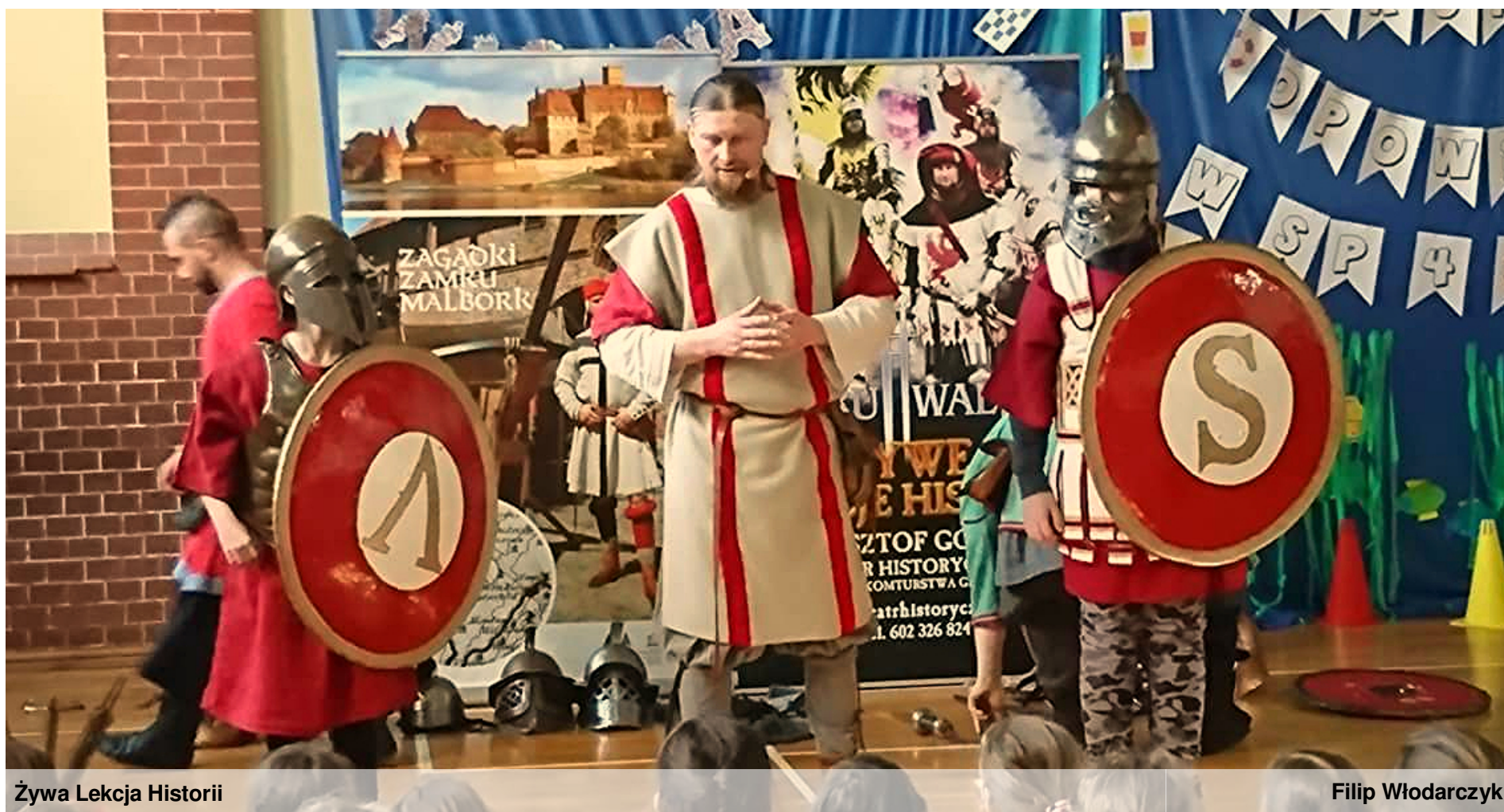
Żywa Lekcja Historii