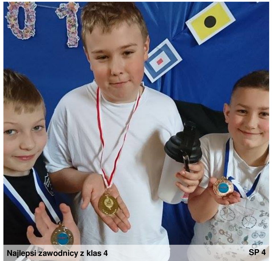
Najlepsi zawodnicy z klas 4