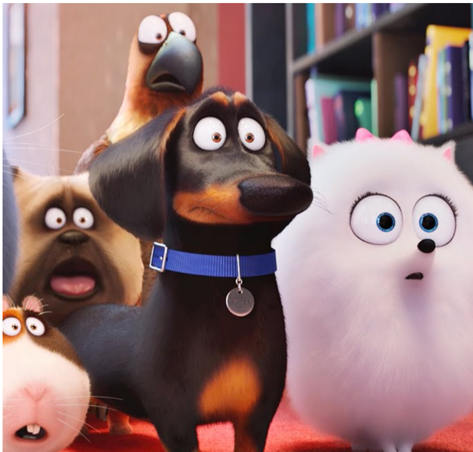
Kadr z filmu