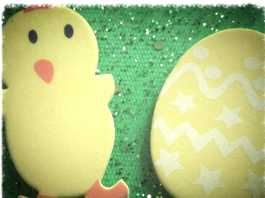
Motyw z kartki świątecznej