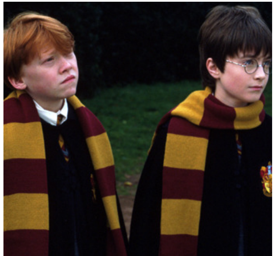
Kadr z filmu