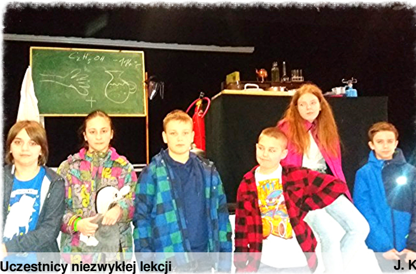
Uczestnicy niezwyklej lekcji