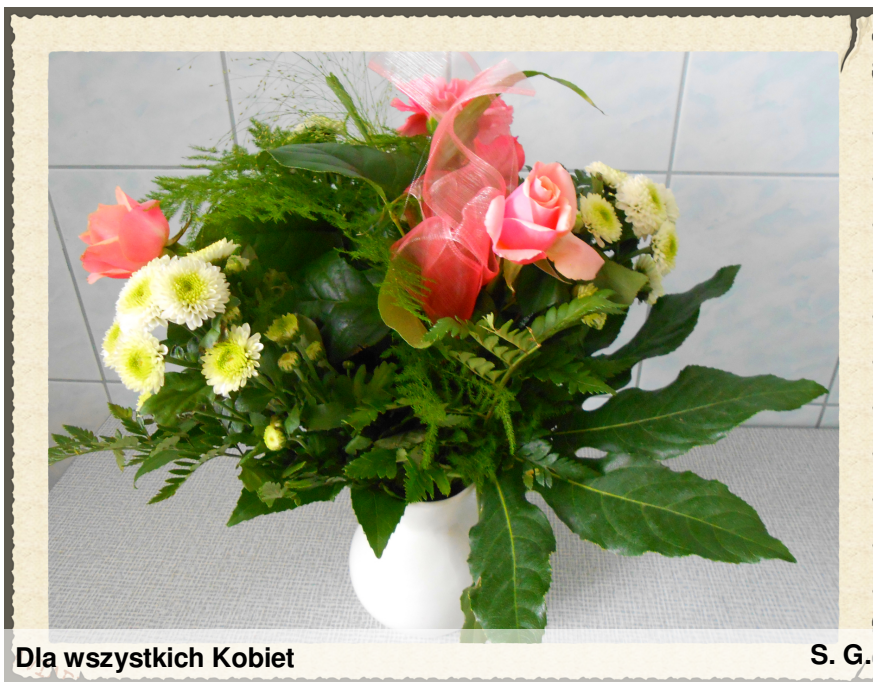
Dla wszystkich Kobiet

Co roku 8 marca obchodzimy Dzień Kobiet. Pierwszy raz obchodzonego w 1910 r. Głównym celem tego święta jest uczczenie pamięci kobiet, które broniły swoich praw.