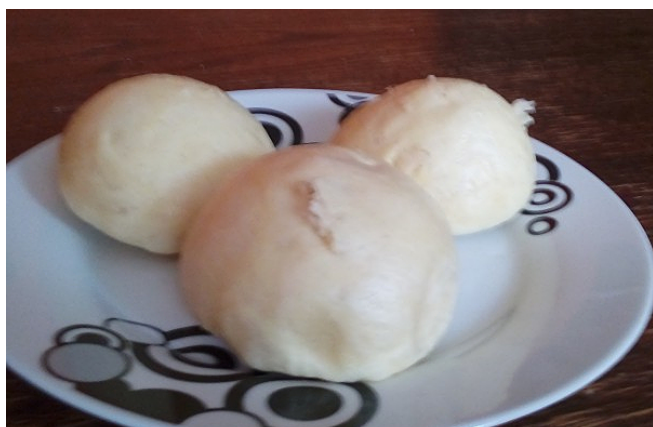
Smakowite i zdrowe

400 g mąki 250 ml mleka 2 jaja 20 g drożdży 2,5 łyżki margaryny 0,5 łyżeczki soli 0,5 łyżeczki cukru