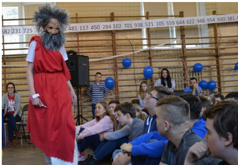
Nawet starożytny matematyk złożył nam wizytę :)