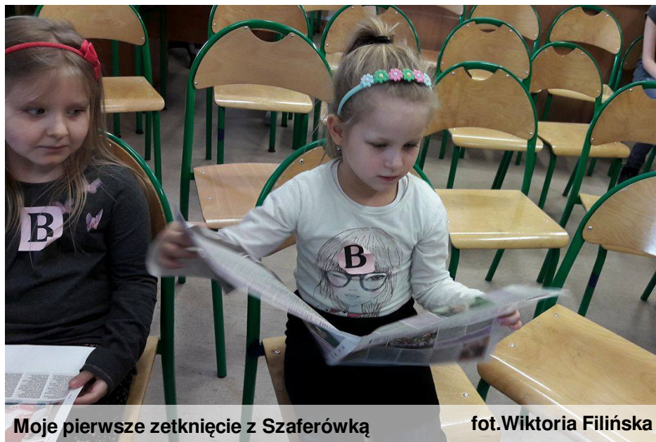
Moje pierwsze zetknięcie z Szaferówką