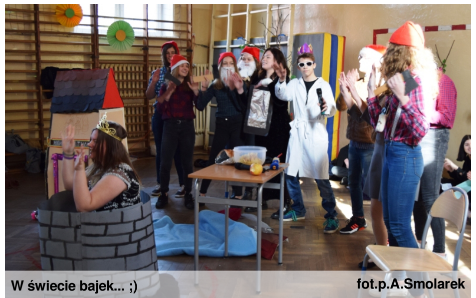
W świecie bajek... ;)