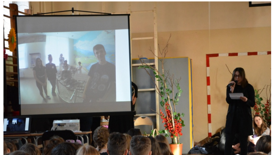
Posłuchajmy o Rosji... :)