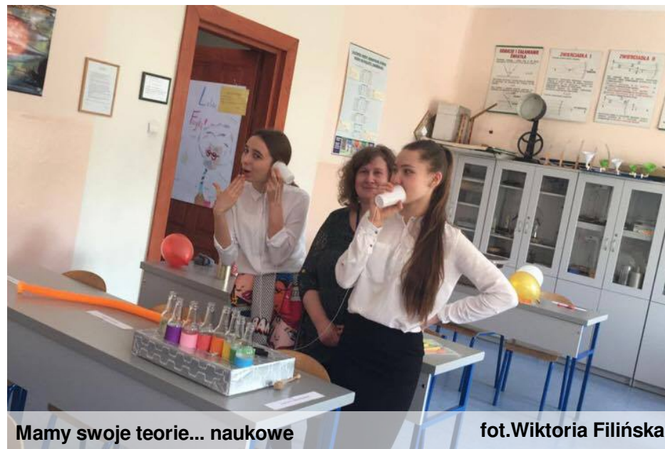
Mamy swoje teorie... naukowe