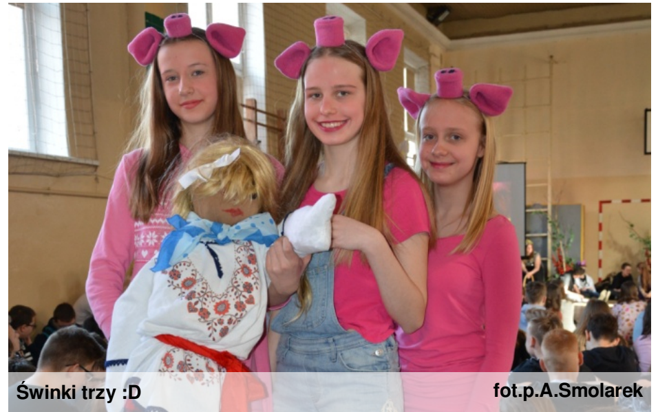
Świnki trzy :D

Zimą pożegnaliśmy zgodnie z polską tradycją. Marzanna Genia odpłynęła z niskimi temperaturami, krótkimi dniami i kapryśną pogodą. Widzowie świetnie bawili się przy piosenkach w języku polskim, rosyjskim oraz niemieckim. Hitem okazał się quiz dla publiczności, dzięki któremu każdy miał szansę dostać ocenę bardzo dobrą z kulturoznawstwa europejskiego.