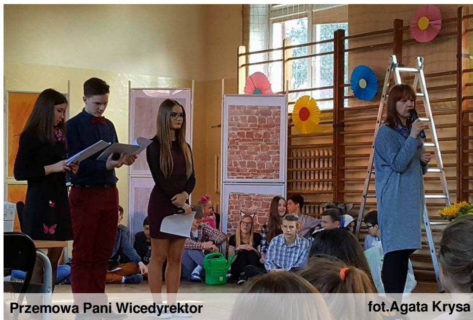
Przemowa Pani Wicedyrektor