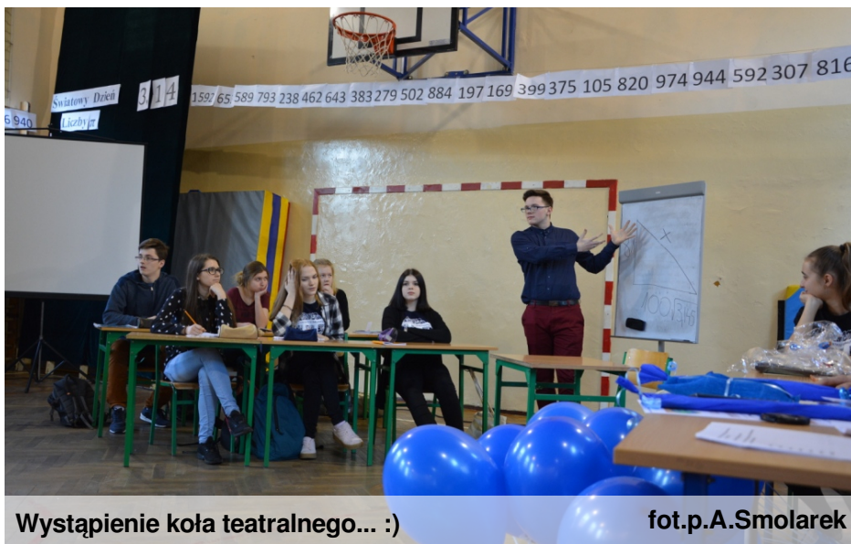
Wystąpienie koła teatralnego... :)