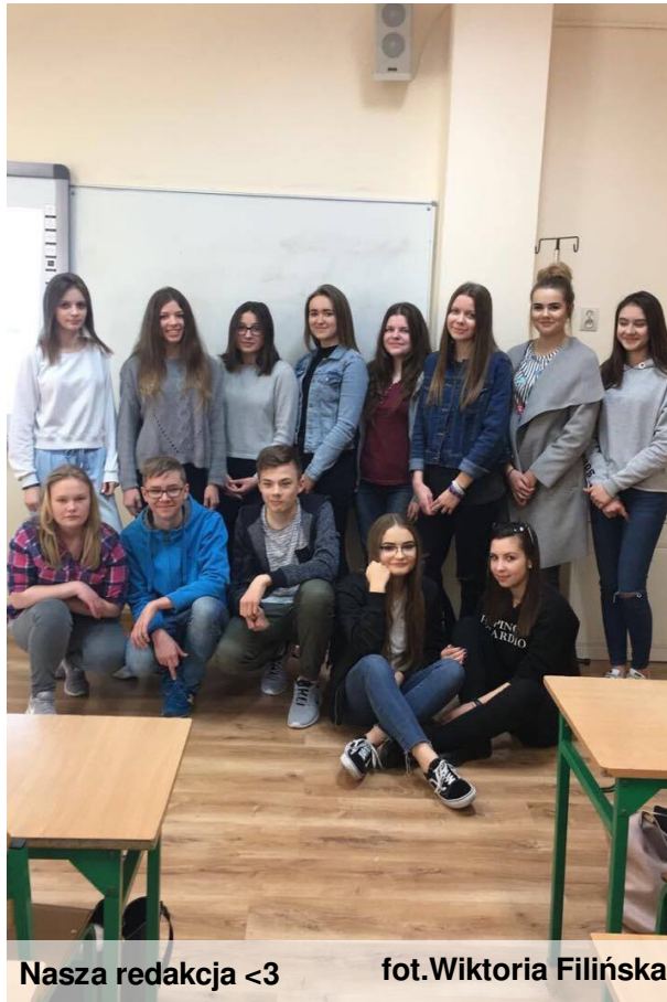
Nasza redakcja <3