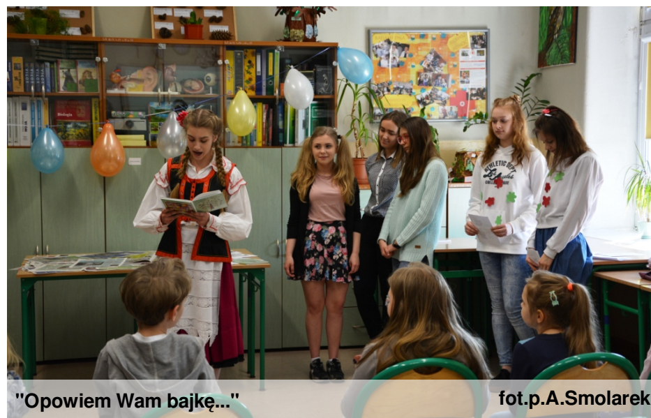
"Opowiem Wam bajkę..."

Dzień Otwarty był doskonałą okazją, by zaprezentować szkołę i zachęcić do wstąpienia w jej progi.