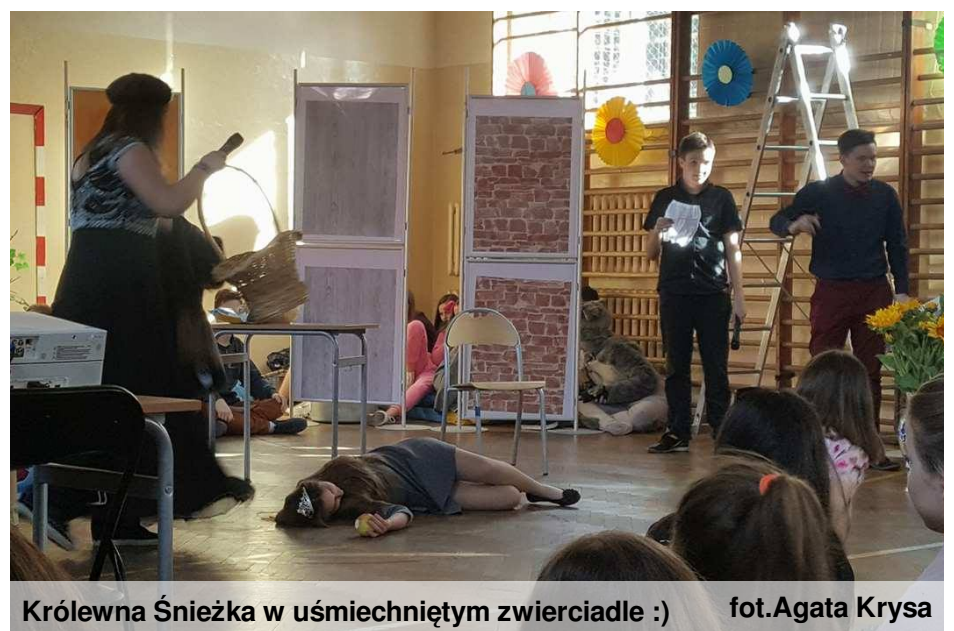
Królowa Śnieżka w uśmiechniętym zwierciadle :)