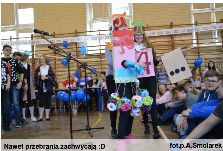
Nawet przebrania zachwycają :D