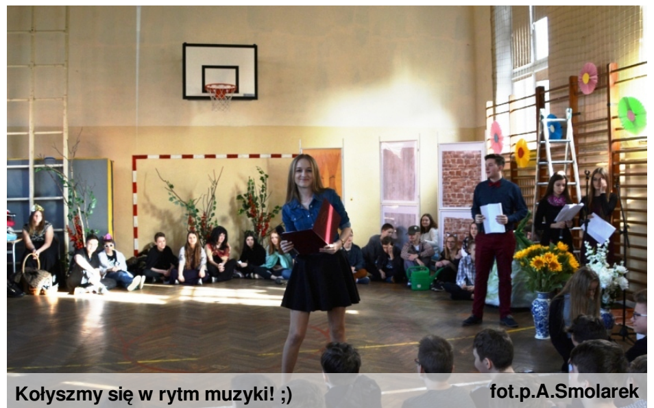
Kończymy się w rytm muzyki! ;)