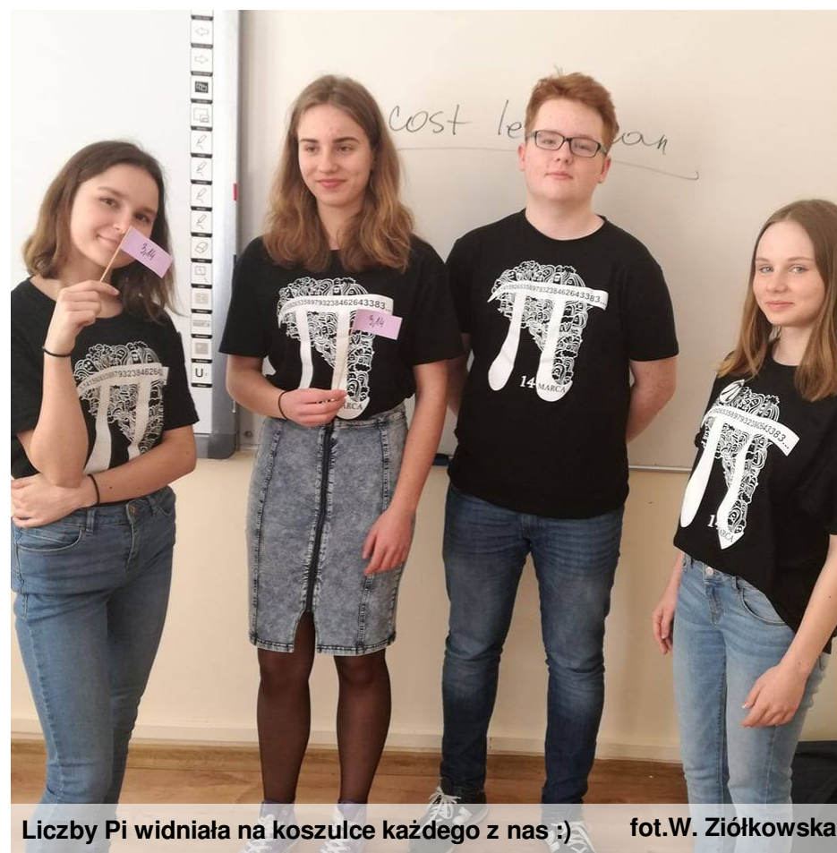
Liczby Pi widniała na koszulce każdego z nas :)

14 marca każdego roku liczba Pi ma swoje święto. Od dwóch lat obchodzimy je również w naszej szkole. Organizatorzy przygotowali liczne konkursy i atrakcje, by popularyzować to święto. Na głównym holu wszyscy uczniowie mogli podczas przerw rozwiązywać matematyczne zagadki, a poprawne odpowiedzi nagradzane były słodkimi nagrodami. Mogliśmy również wysłuchać audycji radiowej, która przybliżyła nam historię liczby Pi i jej znaczenie. Ale o nauce można przecież mówić nie tylko poważnie, ale również na wesoło. Uczniowie klas pierwszych i drugich wzięli udział w licznych konkursach, które zorganizowano na sali gimnastycznej. Jednym z zadań było wyrecytowanie ciągu kolejnych liczb Ludolfiny po przecinku. Drugi konkurs polegał na przebraniu się za liczbę Pi, a kolejny sprawdzał wiedzę matematyczną i przypominał młodzieży pochodzenie i znaczenie liczby Pi w różnych dziedzinach życia. Dodatkową atrakcją tego dnia był występ naszej szkolnej grupy teatralnej, która zaprezentowała wszystkim scenkę dotyczącą oczywiście liczby Pi. Było wiele śmiechu i inteligentnej zabawy, ale chodziło przecież o wiedzę, którą z pewnością zdobyliśmy.