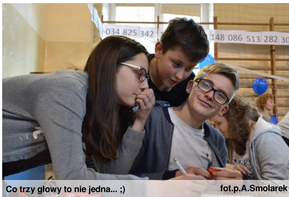
Co trzy głowy to nie jedna... ;)

14 marca każdego roku liczba Pi ma swoje święto. Od dwóch lat obchodzimy je również w naszej szkole. Organizatorzy przygotowali liczne konkursy i atrakcje, by popularyzować to święto. Na głównym holu wszyscy uczniowie mogli podczas przerw rozwiązywać matematyczne zagadki, a poprawne odpowiedzi nagradzane były słodkimi nagrodami. Mogliśmy również wysłuchać audycji radiowej, która przybliżyła nam historię liczby Pi i jej znaczenie. Ale o nauce można przecież mówić nie tylko poważnie, ale również na wesoło. Uczniowie klas pierwszych i drugich wzięli udział w licznych konkursach, które zorganizowano na sali gimnastycznej. Jednym z zadań było wyrecytowanie ciągu kolejnych liczb Ludolfiny po przecinku. Drugi konkurs polegał na przebraniu się za liczbę Pi, a kolejny sprawdzał wiedzę matematyczną i przypominał młodzieży pochodzenie i znaczenie liczby Pi w różnych dziedzinach życia. Dodatkową atrakcją tego dnia był występ naszej szkolnej grupy teatralnej, która zaprezentowała wszystkim scenkę dotyczącą oczywiście liczby Pi. Było wiele śmiechu i inteligentnej zabawy, ale chodziło przecież o wiedzę, którą z pewnością zdobyliśmy.