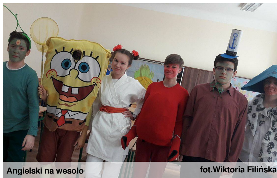
Angielski na wesoło