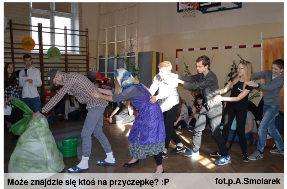
Może znajdzie się ktoś na przyczepkę? :P