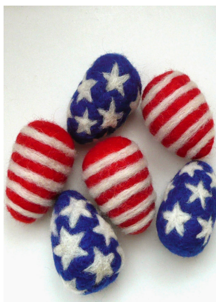
Jajka w USA

Święta Wielkanocne w Stanach trwają tylko jeden dzień, w niedzielę. Nie mają także tradycji święconki ani dzielenia się jajkiem. Wierzą, że jajko ugotowane w Wielki Piątek, a zjedzone w Wielką Niedzielę przyniesie szczęście rodzinie. Popularnym zwyczajem, uwielbianym przez dzieci jest „szukanie skarbów” czy ukrytych czekoladowych jajek w domu i ogrodzie, a także zawody w toczeniu jajek. Amerykanie nie zapominają o dekorowaniu własnych domów. Symbolem kojarzonym ze świętami jest niewątpliwie królik czyli symbol czczenia pogańskiej bogini Estre.