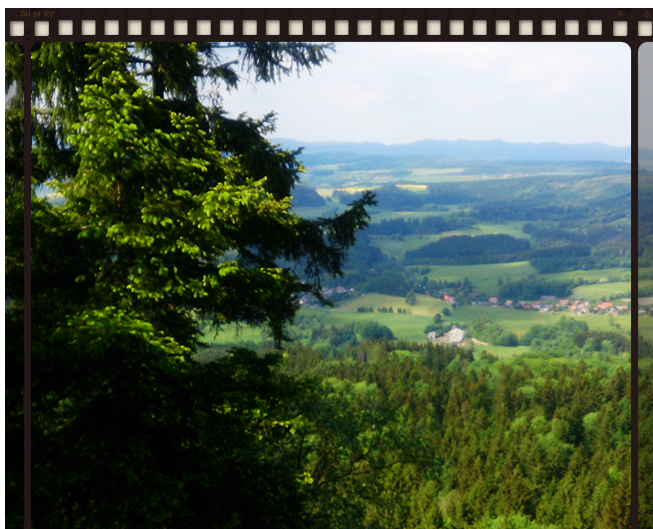
KOTLINA KŁODZKA - VIc i VIh