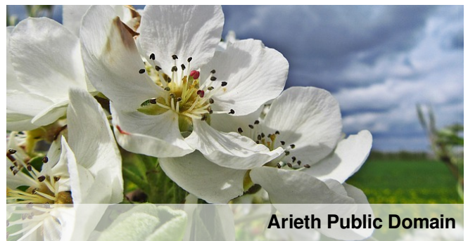
Arieth Public Domain