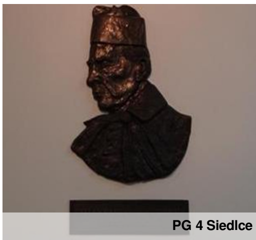
PG 4 Siedlce