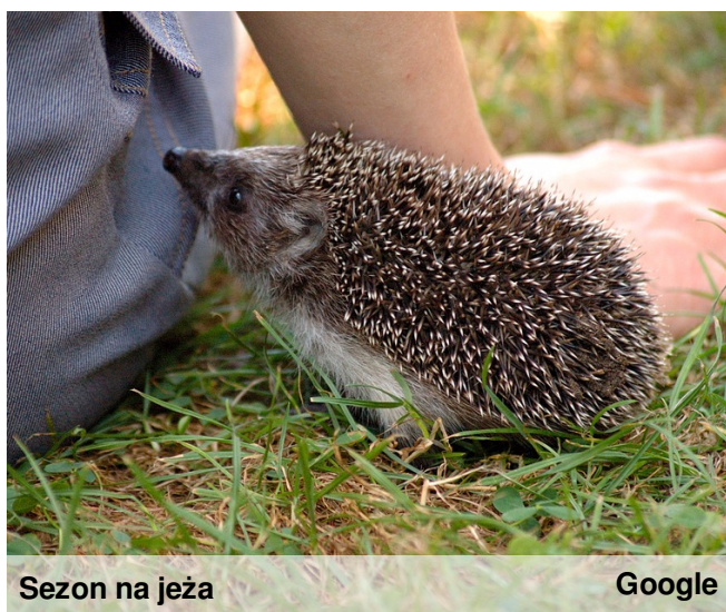
Sezon na jeża

Nie zwlekaj z pomocą! W większości przypadków potrącone zwierzęta da się uratować.