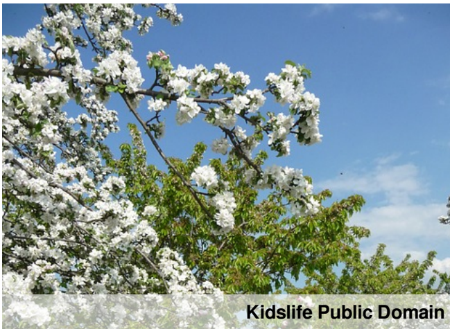
Kidslife Public Domain

Bywają gatunki, których kolory kwiatów są zupełnie białe.