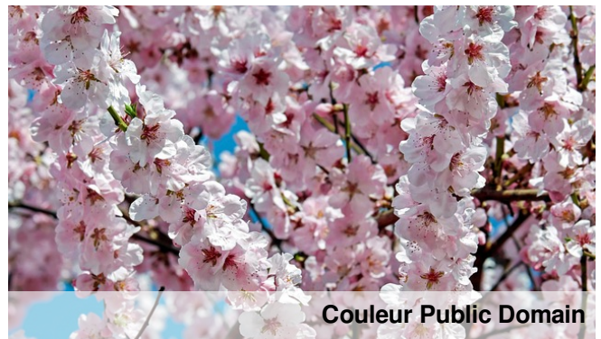
Couleur Public Domain

Równie wspaniale kwiatostany prezentują drzewa wiśni. W Polsce w stanie naturalnym występują tylko dwa gatunki wiśni: wiśnia karłowata oraz czereśnia ptasia. Jako, roślinę ozdobną sadi się wiśnię piłkowaną, popularnie nazywaną japońską. Wiosną obsypuje się różowym kwiatostanem