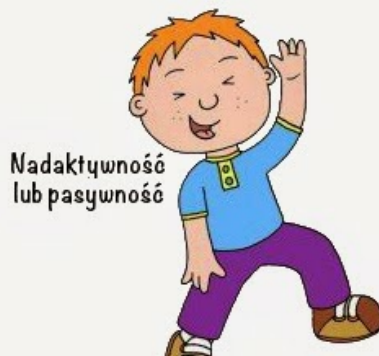
Nadaktywność lub pasywność