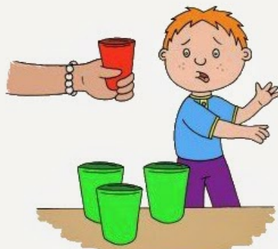
Brak akceptacji zmian