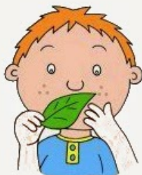
Niezwyczajne przywiązanie do przedmiotów