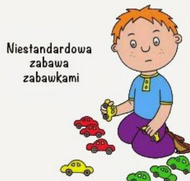
Niestandardowa zabawa zabawkami

Dlatego powstają inicjatywy, które mają propagować wiedzę w kwestii autyzmu. Jedną z nich jest Światowy Dzień Wiedzy na Temat Autyzmu , który przypada na 2 kwietnia . Fundacja