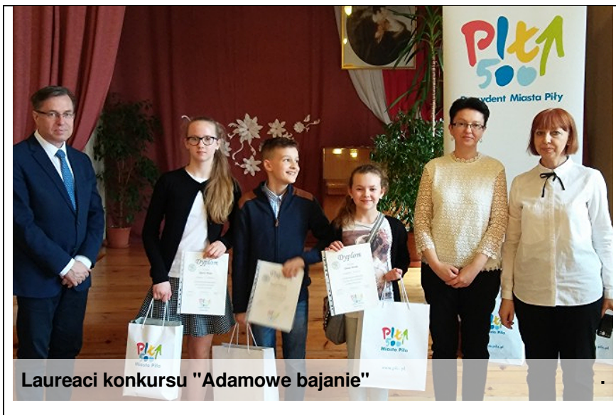
Laureaci konkursu "Adamowe bajanie"