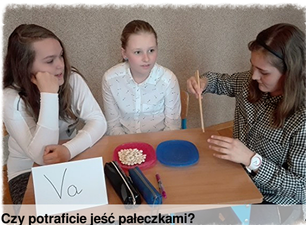
Czy potraficie jeść pałeczkami?

12 kwietnia w auli naszej szkoły odbył się kolejny już turniej Mistrz Dobrych Manier dla klas piątych. Uczniowie przygotowali plakaty związane z tematem turnieju oraz brali udział w różnego rodzaju konkurencjach, a także udzielali odpowiedzi na pytania dotyczące savoir vivre w domu i szkole.