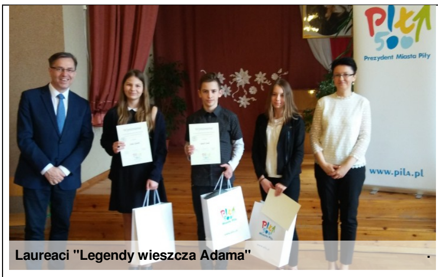
Laureaci "Legendy wieszczka Adama"