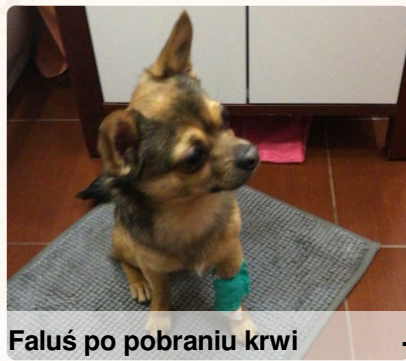
Faluś po pobraniu krwi

Dzisiaj opowiem wam, jak rozwiązywane są problemy zdrowotne mojego pieska.