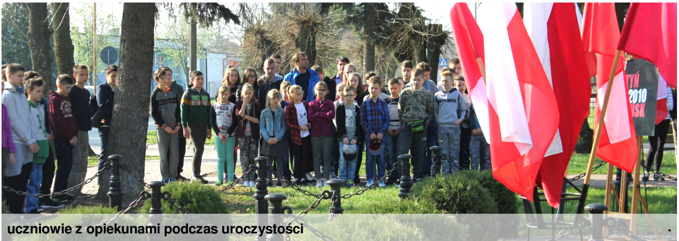
uczniowie z opiekunami podczas uroczystości