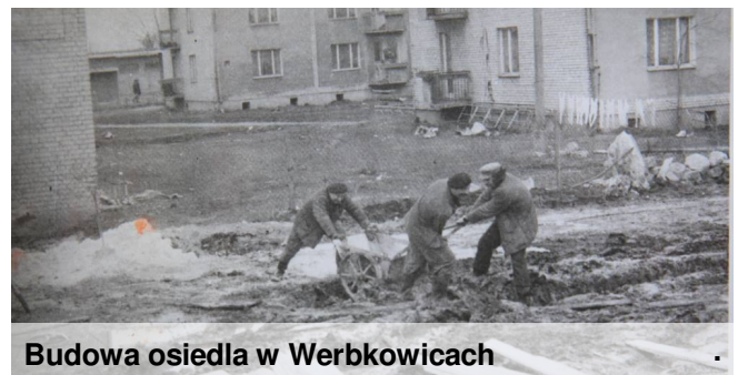
Budowa osiedla w Werbkowicach