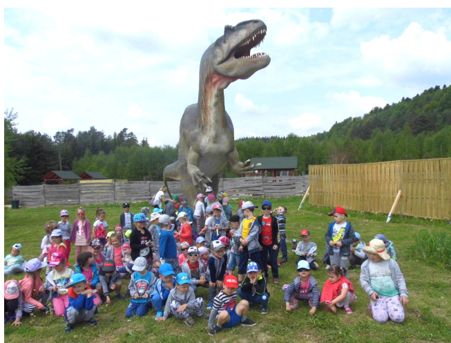
przedszkolaki w Krasnobrodzie

Dzieci z zainteresowaniem oglądały ciekawe okazy ptactwa w mini – ogrodzie zoologicznym, tuż obok zabytkowego spichlerza. Są tu: pawie, gołębie, bażanty, kuropatwy i inne.