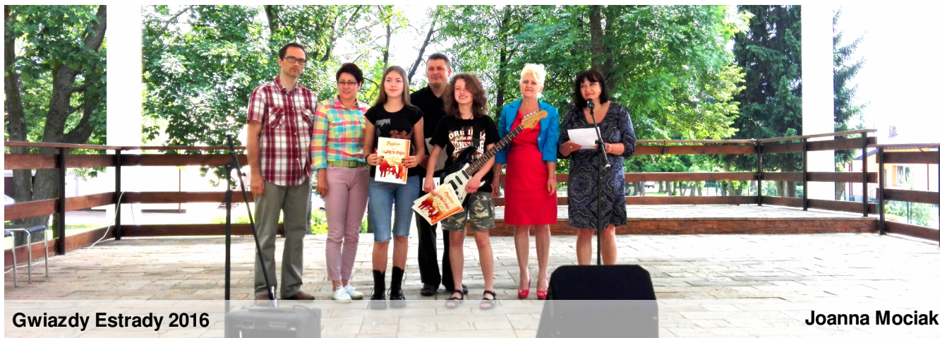
Gwiazdy Estrady 2016