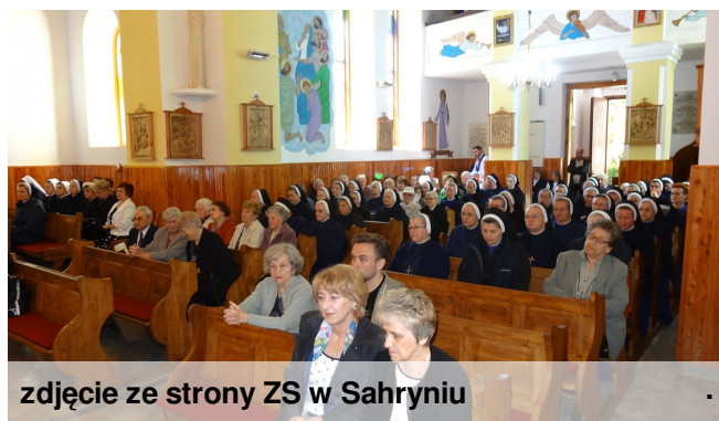
zdjęcie ze strony ZS w Sahryniu