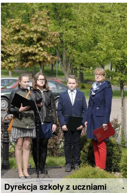
Dyrekcja szkoły z uczniami

W uroczystości wzięli udział Władze Gminy, Dyrekcja i uczniowie oraz nauczyciele i pracownicy naszej szkoły. Nie zabrakło także przedszkolaków.