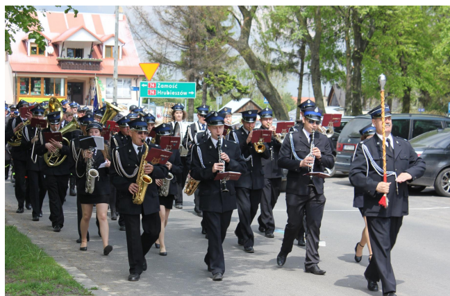
Związek Ochotniczych Straży Pożarnych