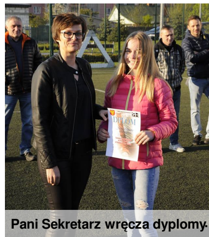
Pani Sekretarz wręcza dyplomy

Lubię czytać książki. Jednak z przykrością muszę stwierdzić, że najczęściej czytam ustawy i rozporządzenia. Zaległości książkowe staram się nadrobić podczas urlopu. Interesuję się historią, w szczególności II wojną światową. Z lżejszej literatury lubię Katarzynę Grochołę.