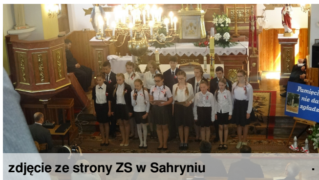
zdjęcie ze strony ZS w Sahryniu