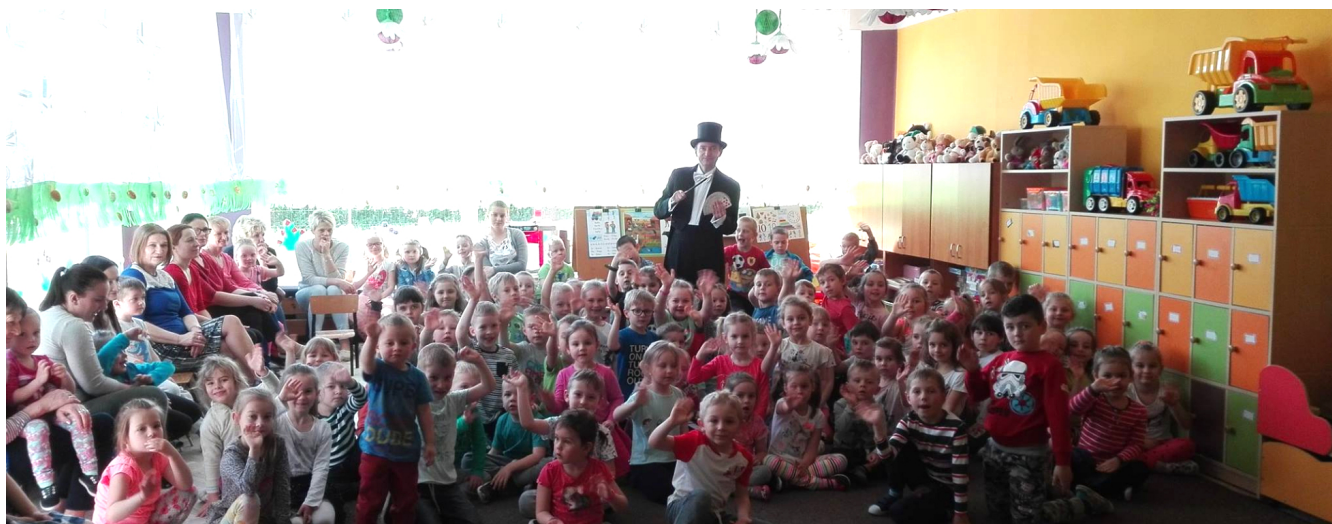
Iluzjonista Magik czarował w „Bajce” 21. 04.

Przedшкоlaki z „Bajki” na wycieczce w Krasnobrodzie