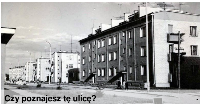
Czy poznajesz tę ulicę?