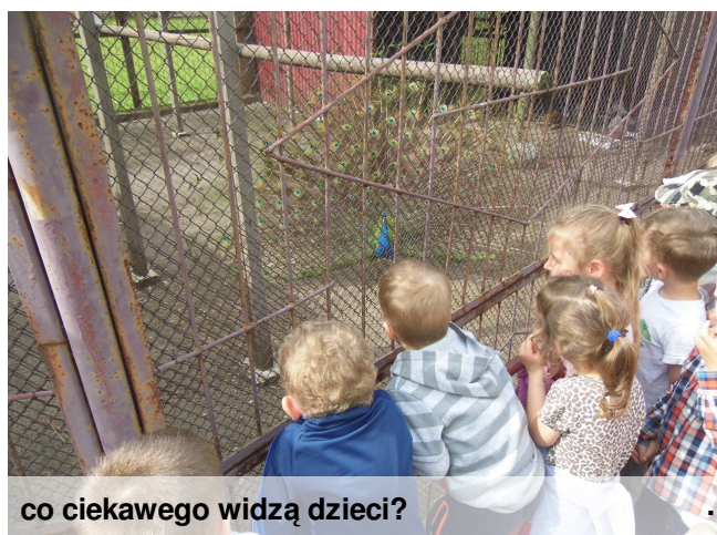
co ciekawego widzą dzieci?

Krasnobród posiada niezaprzeczalne walory klimatyczne, które stanowią o jego dużej atrakcyjności, jako miejscowości wypoczynkowo-wczasowej i uzdrowskiej. Przyjeżdżający latem wypoczywają nad dobrze zagospodarowanym zalewem.