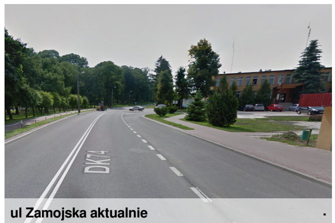
ul Zamojska aktualnie