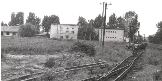
Czy poznajesz to miejsce w Werbkowicach?

Lokalny Program Rewitalizacji Gminy Werbkowice na lata 2017-2023