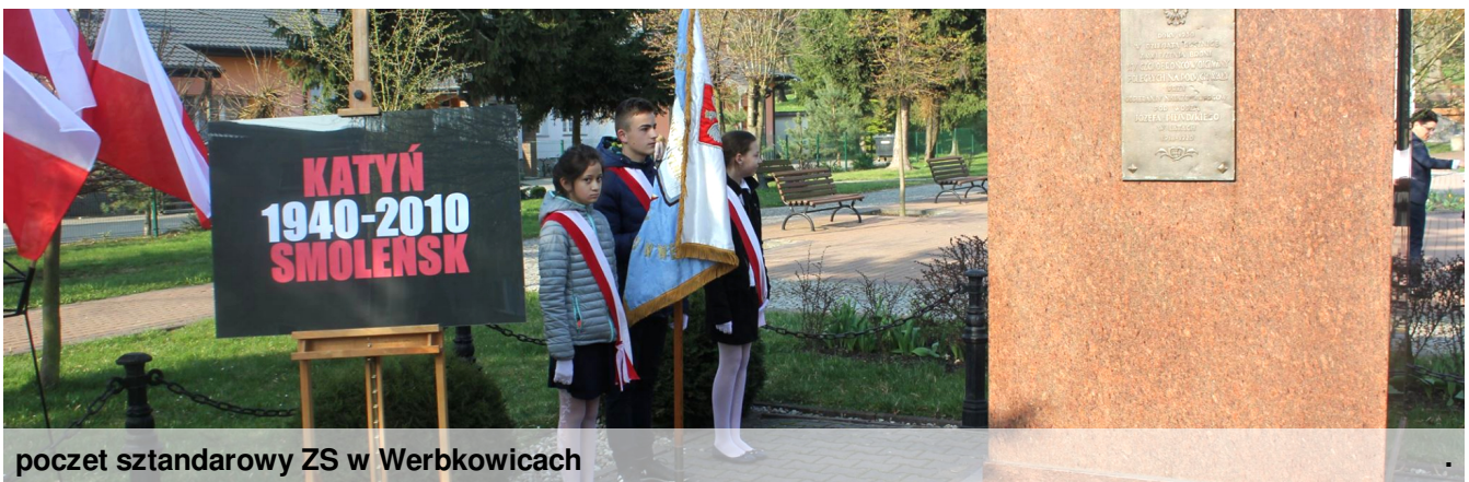
poczet sztandarowy ZS w Werbkowicach

do której doszło w Smoleńsku w sobotę, 10 kwietnia 2010 roku o godz. 8:41 czasu środkowoeuropejskiego letniego. Zginęło w niej 96 osób wśród nich: prezydent RP Lech Kaczyński z małżonką, ostatni prezydent RP na uchodźstwie Ryszard Kaczorowski, wicemarszałkowie Sejmu i Senatu, grupa parlamentarzystów, dowódcy wszystkich rodzajów Sił Zbrojnych RP, pracownicy Kancelarii Prezydenta, szefowie instytucji państwowych, duchowni, przedstawiciele ministerstw, organizacji kombatanckich i społecznych oraz osoby towarzyszące i załoga samolotu.