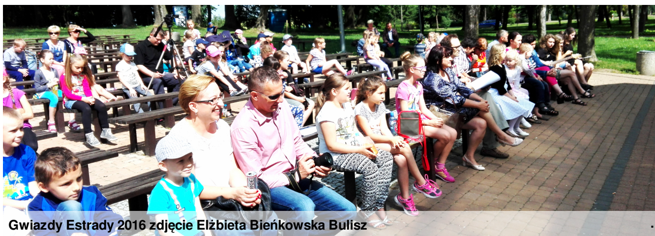
Gwiazdy Estrady 2016