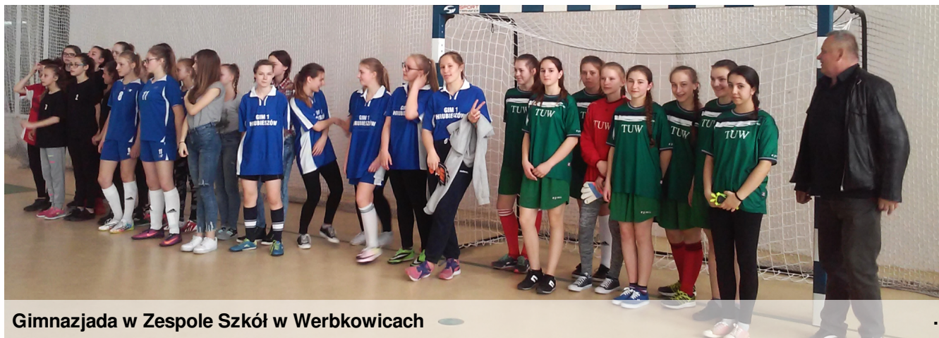
Gimnazjada w Zespole Szkół w Werbkowicach

Dnia 11.04.2017r. w Hali Zespołu Szkół w Werbkowicach odbyła się Powiatowa Gimnazjada piłki nożnej dziewcząt. Po ubiegłorocznej wygranej naszych dziewczyn apetyt na zwycięstwo był po cichu oczekiwany. A jak wyglądało to w tym roku zamieszczamy poniżej. Turniej zagrano systemem „każdy z każdym” a nasz hrubieszowski powiat reprezentowało pięć zespołów: