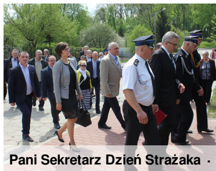
Pani Sekretarz Dzień Strażaka -

Woody Allen kiedyś powiedział „Jeśli chcesz rozśmieszyć Boga, opowiedz mu o twoich planach na przyszłość”. Dlatego staram się nie planować zbyt dużo. Swoją przyszłość wiążę z dalszą pracą na rzecz naszej gminy.