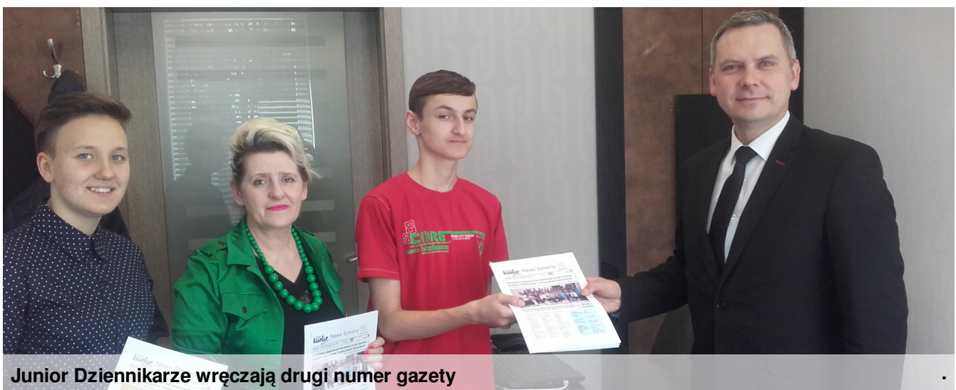
Junior Dziennikarze wręczają drugi numer gazety