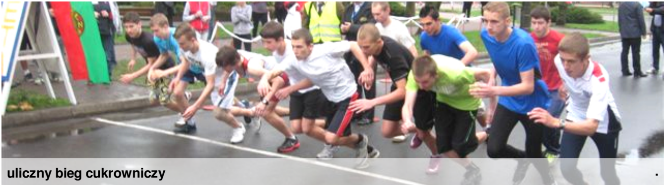
uliczny bieg cukrowniczy