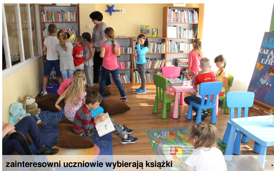
zainteresowni uczniowie wybierają książki

Dzieci z zainteresowaniem uczestniczyły w zajęciach i wspaniale radziły sobie ze zleconymi im zadaniami. Wizyta dla uczniów była znakomitą zabawą.