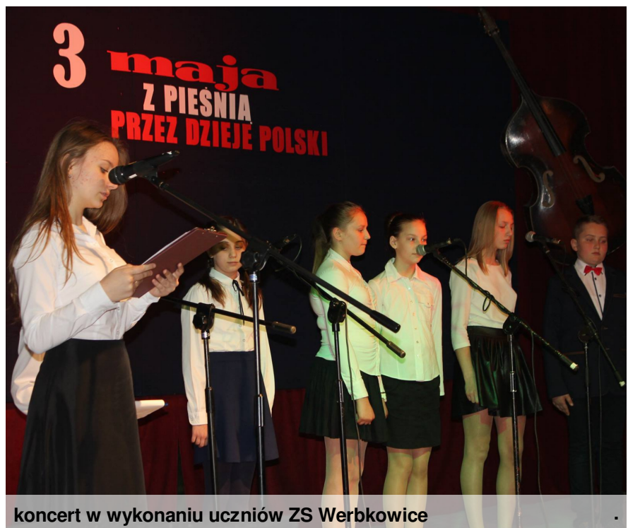
koncert w wykonaniu uczniów ZS Werbkowice