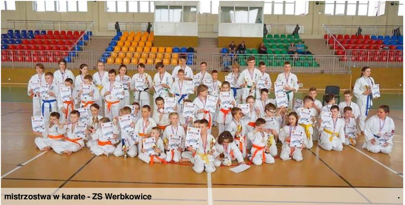
mistrzostwa w karate - ZS Werbkowice