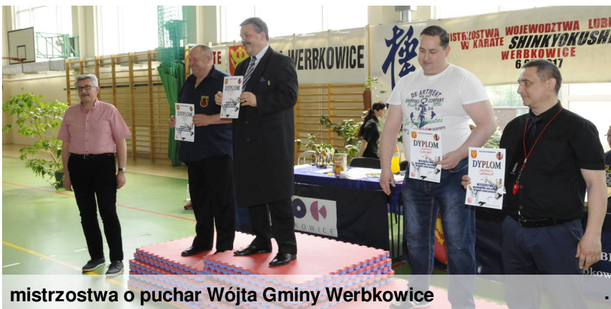
mistrzostwa o puchar Wójta Gminy Werbkowice

odbyły się w hali sportowej Zespołu Szkół w Werbkowicach 6 maja 2017 roku o godzinie 10:00