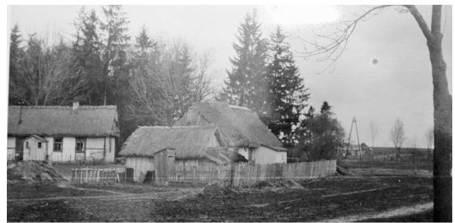
Aż trudno uwierzyć, że to centrum Werbkowic