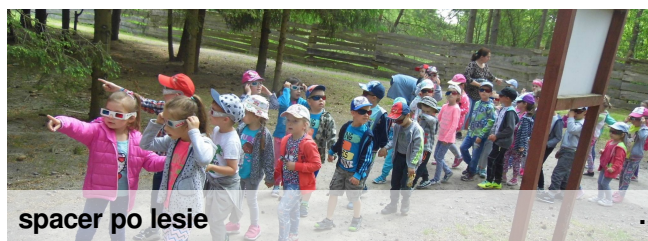
spacer po lesie

Krasnobród posiada niezaprzeczalne walory klimatyczne, które stanowią o jego dużej atrakcyjności, jako miejscowości wypoczynkowo-wczasowej i uzdrowskiej. Przyjeżdżający latem wypoczywają nad dobrze zagospodarowanym zalewem.