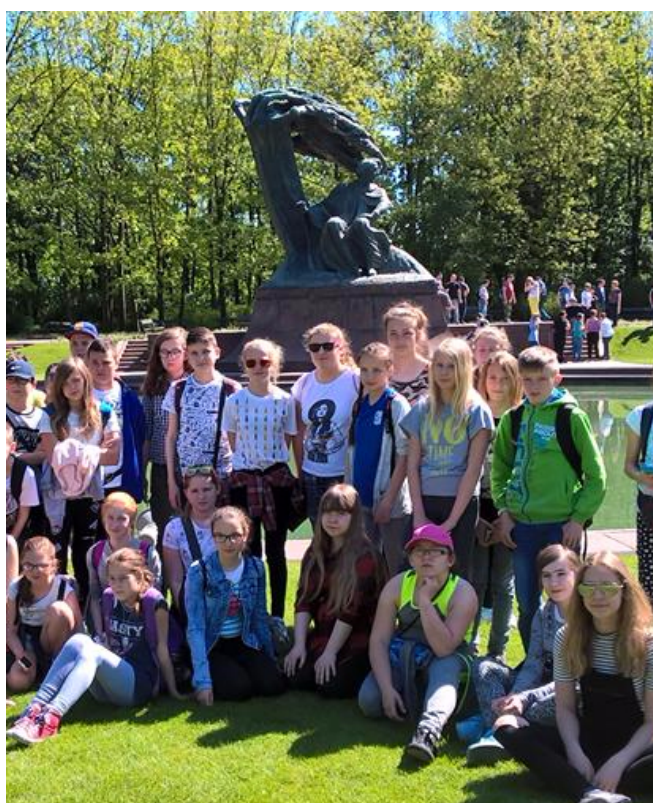
WYCIECZKA DO WARSZAWY