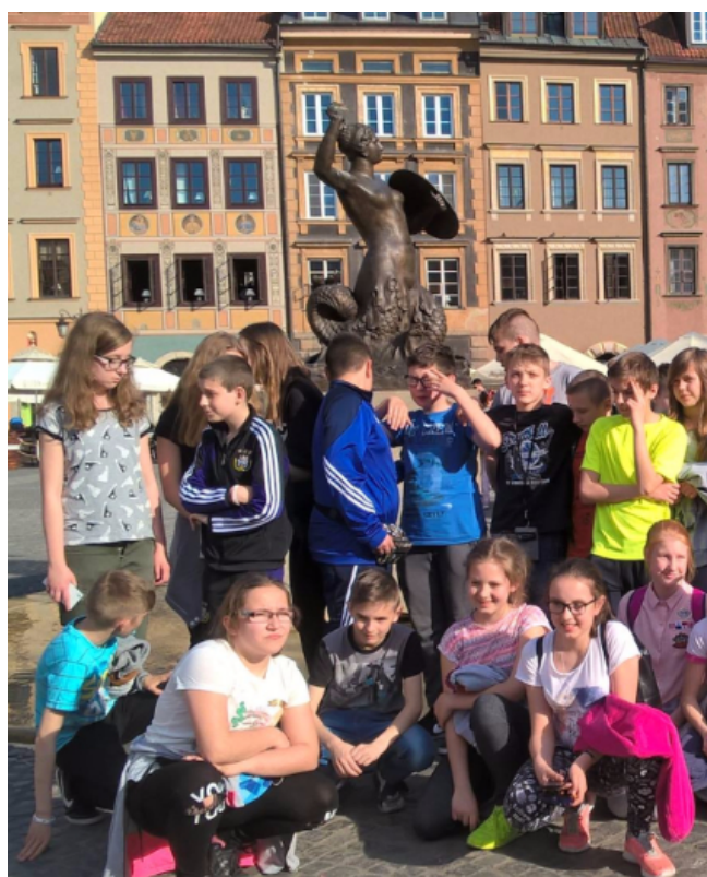
WYCIECZKA DO WARSZAWY