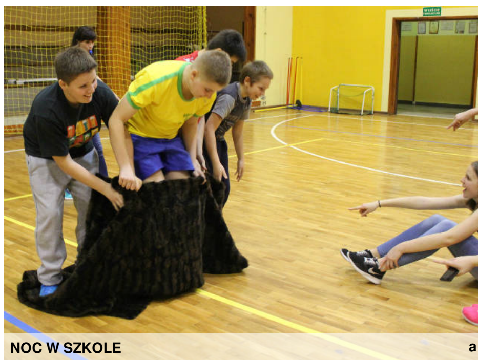
NOC W SZKOLE