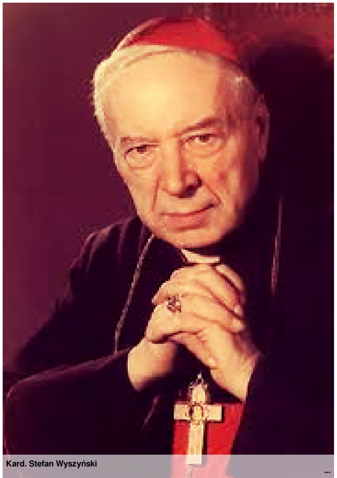
Kard. Stefan Wyszyński