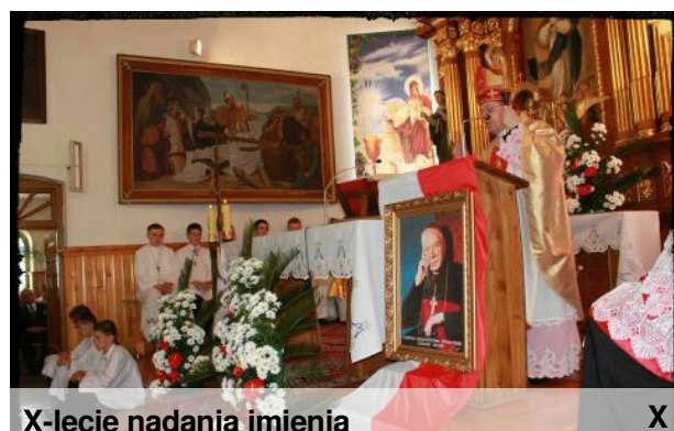
X-lecie nadania imienia