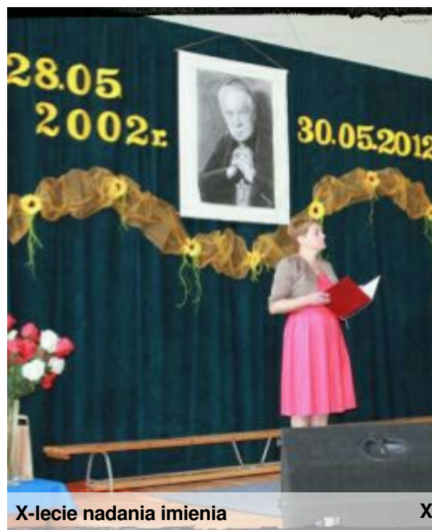
X-lecie nadania imienia