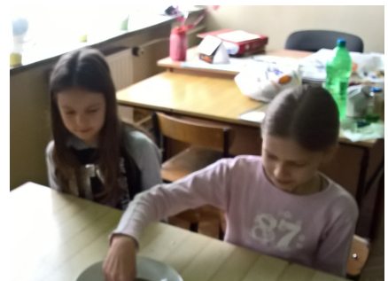
Eksperyment przyrodniczy N.SZ.

Ciekawe zjawisko zaobserwowaliśmy wykonując eksperyment z wodą, pieprzem i płynem do mycia naczyń. Napełniliśmy talerz wodą i posypaliśmy powierzchnię cieczy zmielonym pieprzem. Zanurzyliśmy palec w wodzie – nic ciekawego się nie działo. Gdy, zgodnie z instrukcją, zamoczyliśmy palec w detergencie i ponownie dotknęliśmy powierzchni wody, zauważyliśmy, że drobinki pieprzu na powierzchni wody zaczęły „uciekać” od palca w kierunku brzegu naczynia. Dowiedzieliśmy się, jaka była przyczyna powstania tego zjawiska.