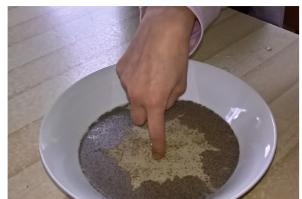
Eksperyment przyrodniczy N. Sz.