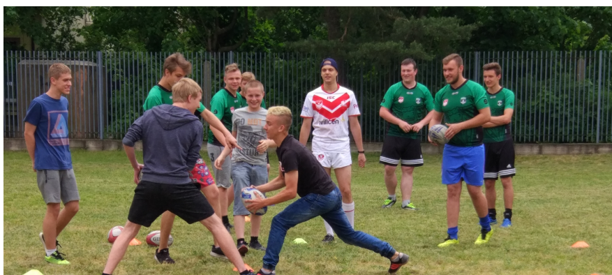
Nsi uczniowie uczą się grać w rugby