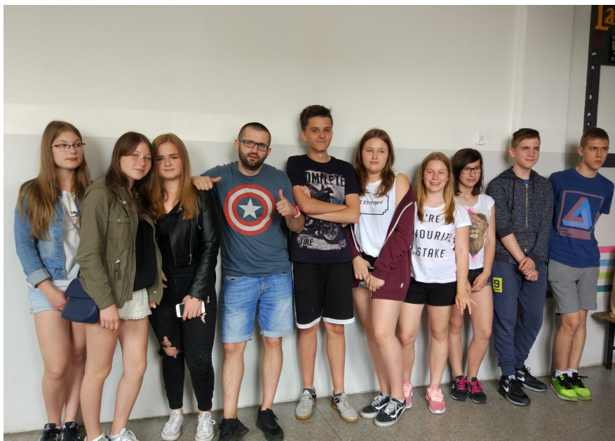
Nasi uczniowie z raperem