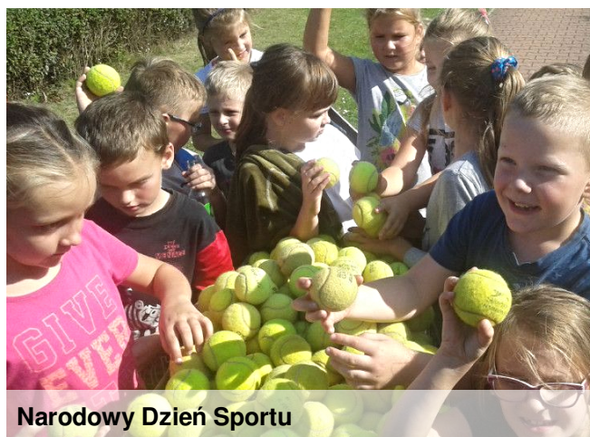
Narodowy Dzień Sportu

Uczniowie klas młodszych wzięli udział w czwartej edycji tenisowego święta WTA Katowice Open oraz uczestniczyli w imprezie towarzyszącej Talentiadzie sportowej, zajmując 2 miejsce. Uczniowie oglądali również mecze tenisowe i kibicowali najlepszym tenisistkom.