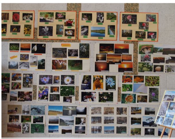
Fragment wystawy nadesłanych prac