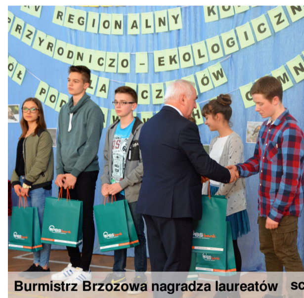
Burmistrz Brzozowa nagradza laureatów