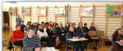
VIII edycja Konkursu