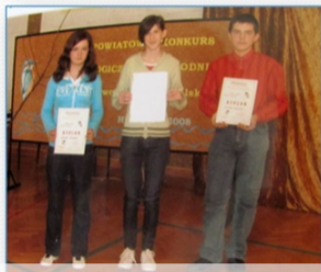
VI edycja Konkursu