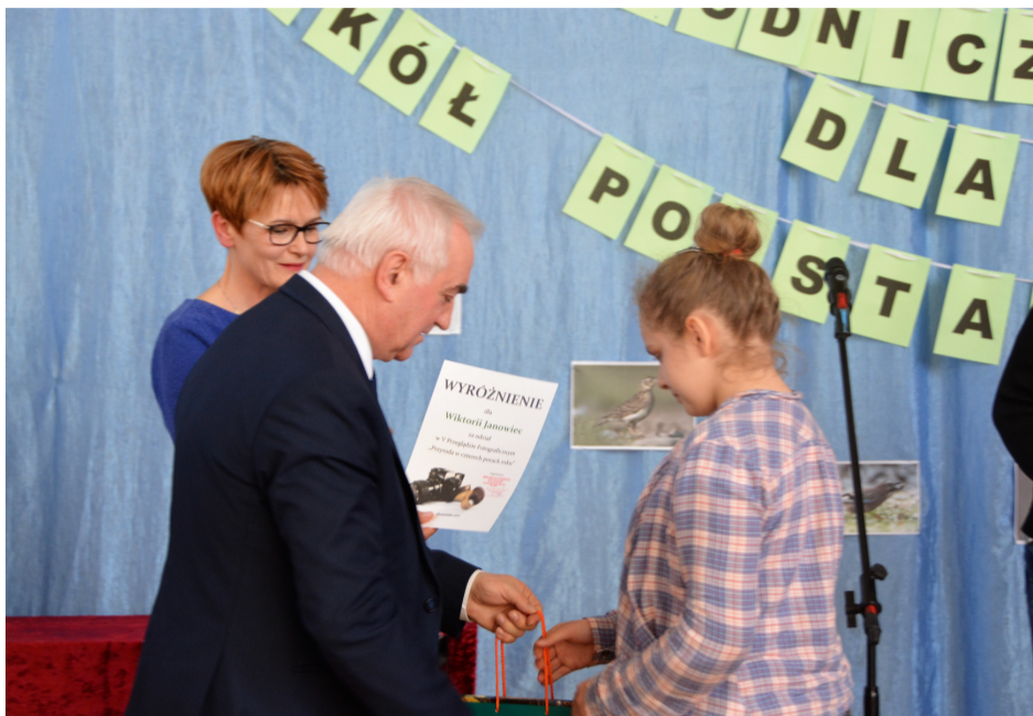
Burmistrz Brzozowa i Dyrektor szkoły wręczają nagrody laureatom sc