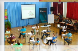
XI edycja Konkursu