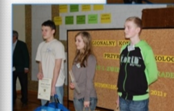
IX edycja Konkursu