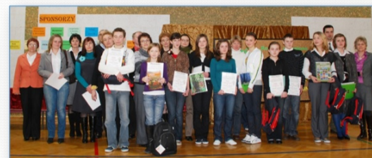
VII edycja Konkursu