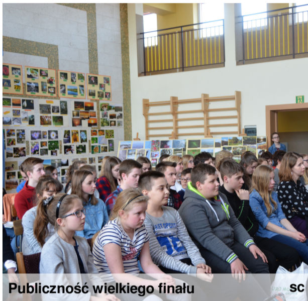
Publiczność wielkiego finału