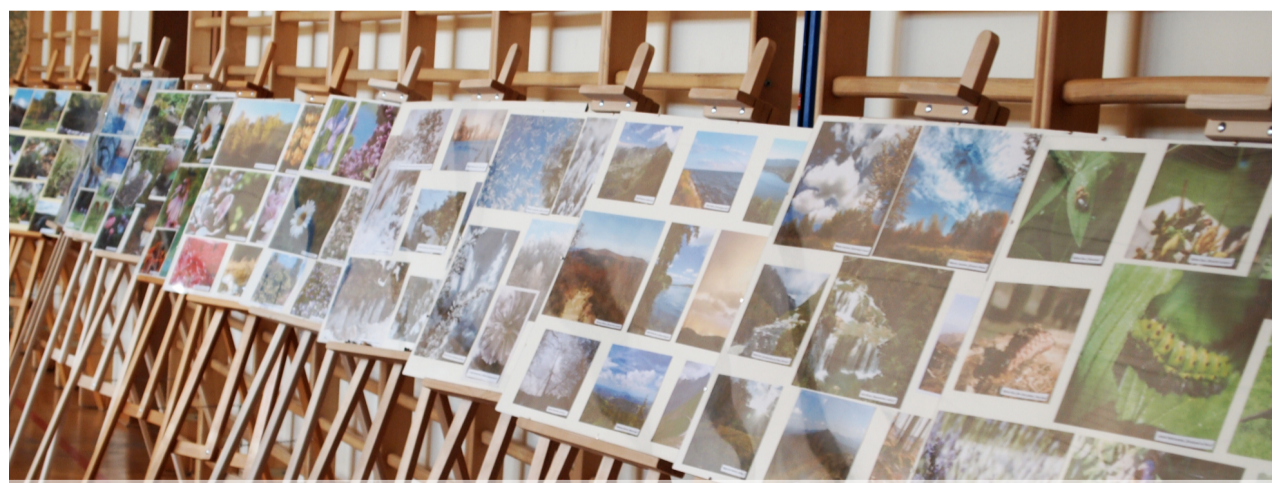
Wystawa fotografii przyrodniczej uczniów z powiatu brzozowskiego