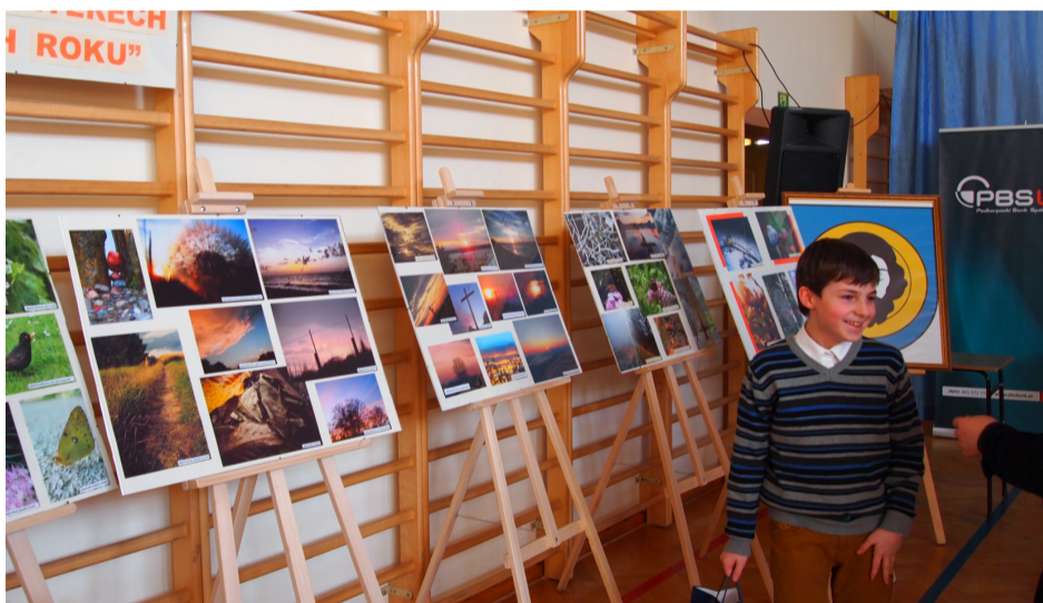
Szczęśliwy laureat Przeglądu Fotograficznego