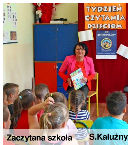
Zaczytana szkoła S.Kałużny