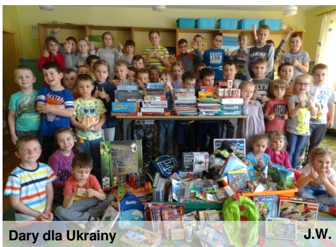
Dary dla Ukrainy