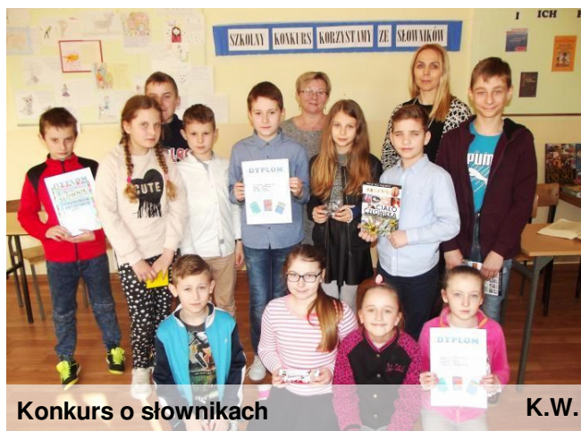
Konkurs o słownikach