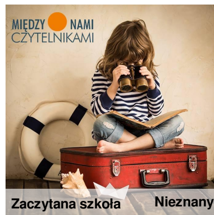
Zaczytana szkoła Nieznany