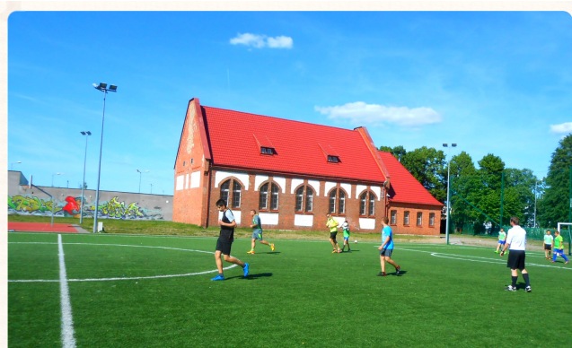
Kto wygra: rodzice czy uczniowie?