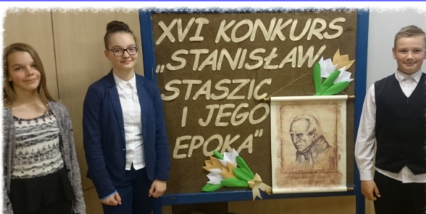
Reprezentanci naszej szkoły