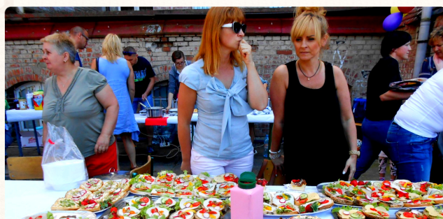
Kolorowe i zdrowe kanapki