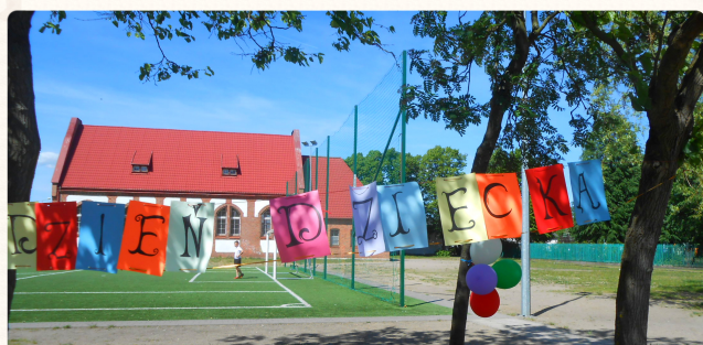
Festyn "Pociągiem po zdrowie"