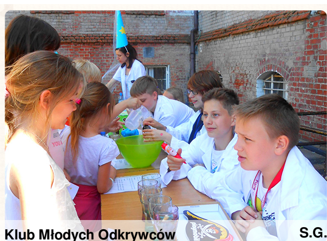
Klub Młodych Odkrywców