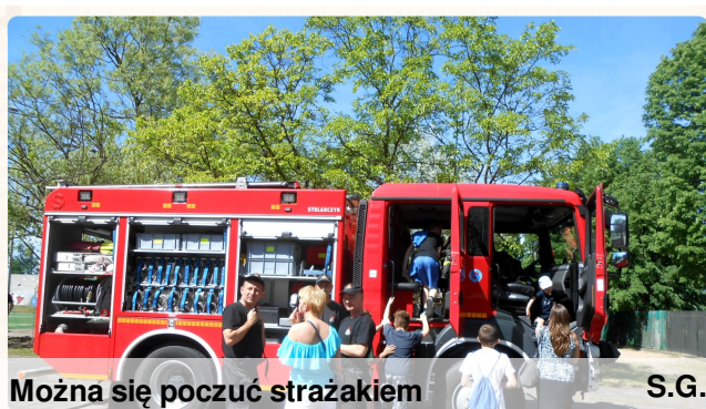
Można się poczuć strażakiem