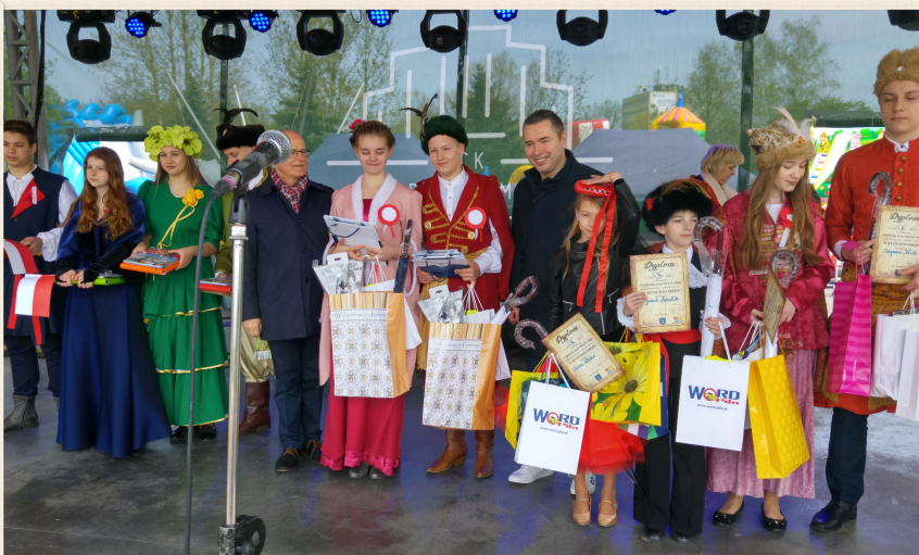
Nasza para wśród zwycięzców

I robią to przy każdej nadarzającej się okazji. A było ich ostatnio wiele.