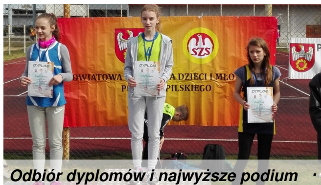
Odbiór dyplomów i najwyższe podium