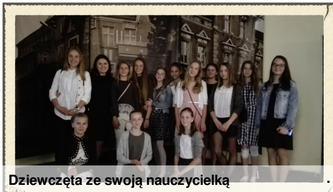
Dziewczęta ze swoją nauczycielką