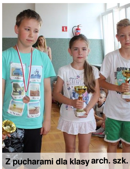
Z pucharami dla klasy arch. szk.

W kategorii MAKULATURA puchar otrzymała klasa VI. W kategorii NAKRĘTKI puchar zdobyła klasa IIIb, a w kategorii BATERIE puchar powędrował do klasy IIIa.