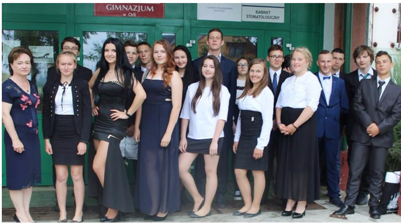
Klasa III -już absolwenci