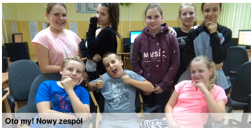
Oto my! Nowy zespół