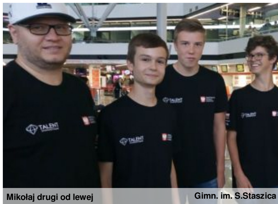
Mikołaj drugi od lewej