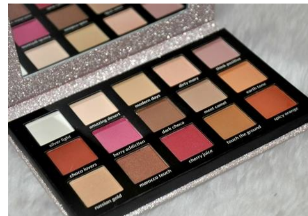
PALETKA CIENI WIBO