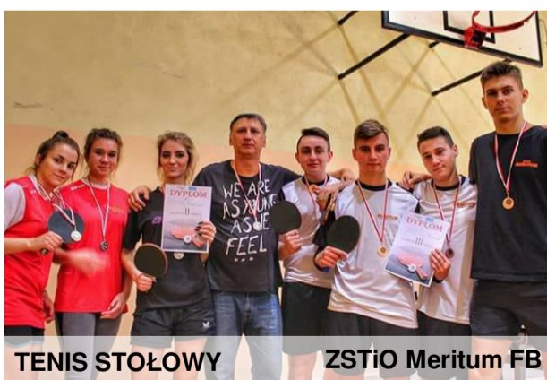
TENIS STOŁOWY ZSTiO Meritum FB

17.10.2017 r. w naszej szkole odbyły się międzyszkolne zawody w tenisie stołowym. Przed rozpoczęciem zawodów uczestnicy zapoznali się z regulaminem, następnie dyrektor ZSTiO "Meritum" wystąpił z przemówieniem. Każdy z uczestników dawał z siebie wszystko. Reprezentanci naszej szkoły byli w świetnej formie. Nasze dziewczyny zdobyły srebro a chłopcy brąz. Gratulujemy!