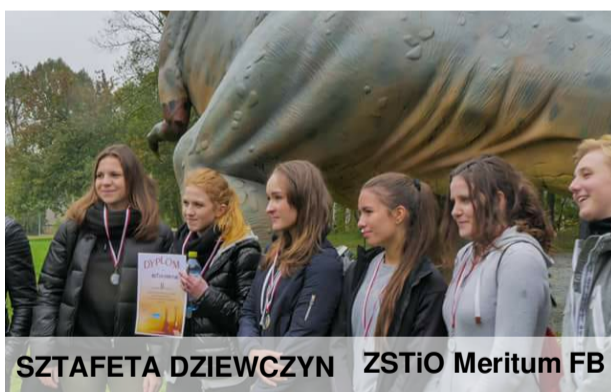
SZTAFETA DZIEWCZYN ZSTiO Meritum FB

10.10.2017 r. wokół stawu Rzęsa w Siemianowicach Śląskich dzielnie biegali sztafetowcy. Mimo niesprzyjających warunków pogodowych, reprezentanci Meritum dawali z siebie wszystko. W zawodach stanęły cztery szkoły do konkurencji dziewczyn oraz pięć szkół do konkurencji chłopców. Reprezentantki naszej szkoły zajęły drugie miejsce, chłopcom udało się wywalczyć złoto. Gratulacje!